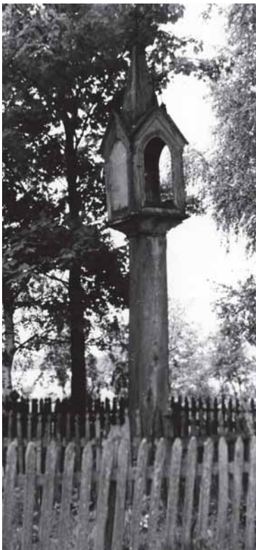
Iš kairies: Ēlutēs rajona Gardama apilinkēs Uļlaukēs kaima koplitstulpis ēr tuo patēis rajona Dviekōnas apilinkiu skulptūra „Dv. Jūzaps” ēr koplitelē medie. 1966. gada