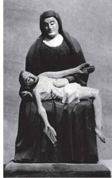
Leviškiu kaima (Dėlutės rajuons) ūventūju skulptūras ėr tuo patėis rajuona Pabremenės kaima skulptūra „Pietà“. Portėgrapouta 1964 metās. Autuorç neþėnuomė.