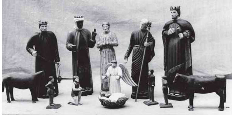
Ēlutēs rajona Pajūralē kaima skulptūreles. 1964. gada.