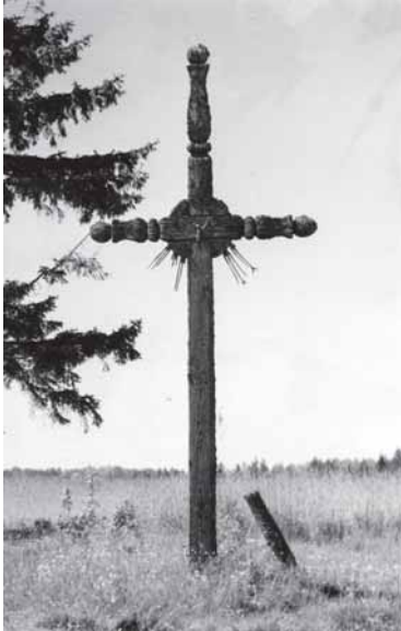
Ēlutēs rajona Pajerubēs kaima kriņģis. 1966. gada