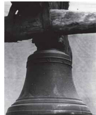
Kairie – Dėlutės rajuona Pabremenės kaima koplitelė medie. Vėrėou – Upinas kaima (Dėlalės rajuons) varpā