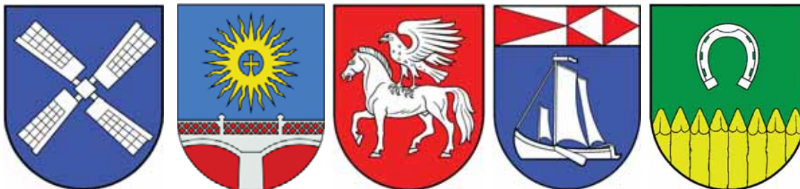
Dėlutės rajono miestėliu herbā (iė kairės): Saugū, Đviekėnas, Juknaitiu, Rusnės, Gardama