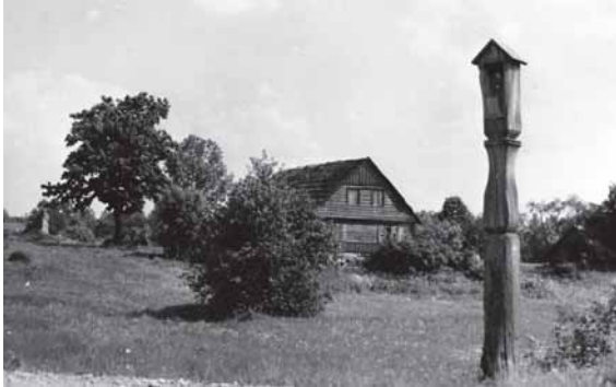
Vėrđou ėr deđėnie – Brokuoriu kaima (Gardamo apil.) koplitstulpis ėr koplitelė. 1966 m.