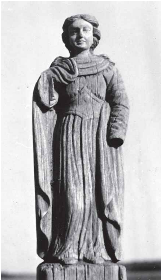
vėrđou – Koėaitiu kaima medė skulptūra; deđėnie – Degutiu kaima koplitelė. 1966 m.

Publėkacėju panauduotas nespalvuotas portėgrapėjės – Sakalauskė Meėisluova