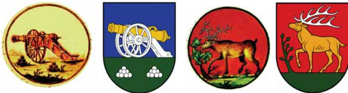
Iš kairės: Vainuta, Deguėiu miesteliu (Dėlutės rajuons) herbà 1792 metàs ėr dabar

dalės pėmaitėjç, kėta – Maėàjç Lietuvà. No vo Dėlutė... Tas rajuons tçp pat i kelės dalės pagal mūsa tradicinė kultūra ir skėrstuoms.