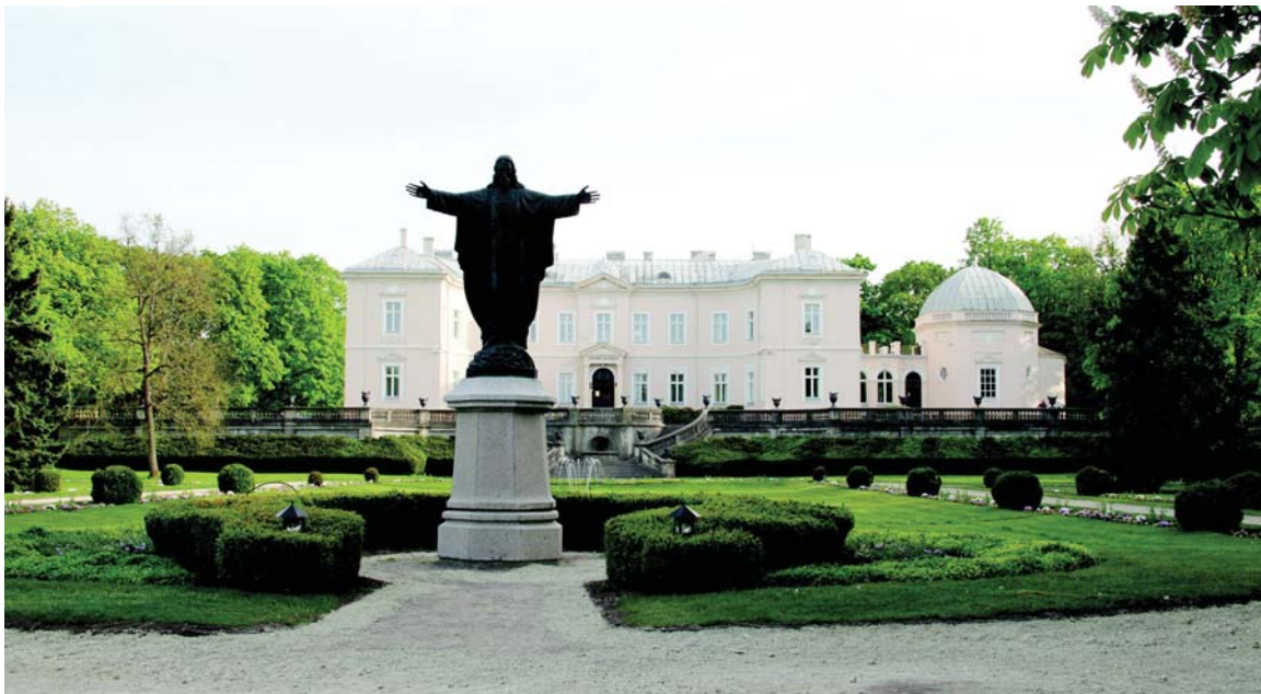
Palonguos gintara muziejos, dėdliesis parka parteris ėr „Laimėnontė Kristaus“ skulptūra (atkūrė skulptuorios Žirgulis Stasīs) prišās rūmus