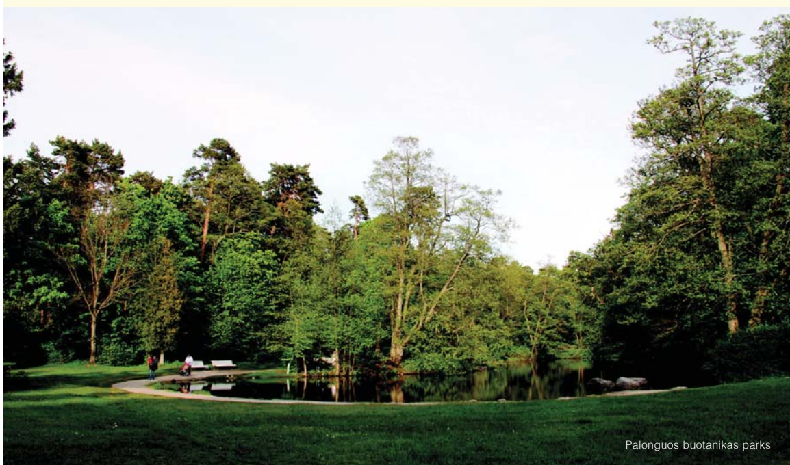
Palonguos buotankas parks