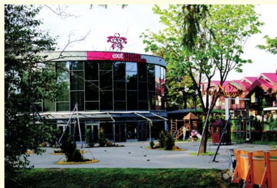
Atstatītē, rekonstoutē, restaurotē pastatā Basanavičē gatvie; skulptūra „Eglē žaltīu karalienē” (skulptuoriuis Antinis Ruoberts vīresnisis) Palonguos buotankas parkē