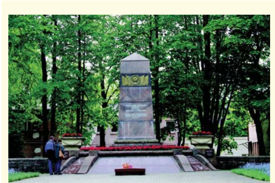
Ontrājēmē pasaulēnēmē karē žovusiu Sovietu armējēs kariū kapēnēs Palonguo