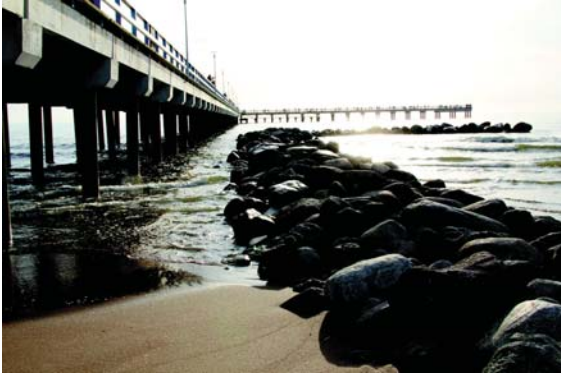
Vēršou – Palonguos tēlts i jūra. Dešēnie – Palonguos buotanikas parka fragmētā, parka ruozariums pri rūmu, katramē stuov Louis-Noelē Huberta 1913 m. sukorta balta granita skulptūra „Vondēns nešiejē”. Šarapuova S, Knīvas A. skulptūrinis ansamblis „Šaulis” unt senūju Palonguos kapieliu (Palonguos buotanikas parka terētuorē)