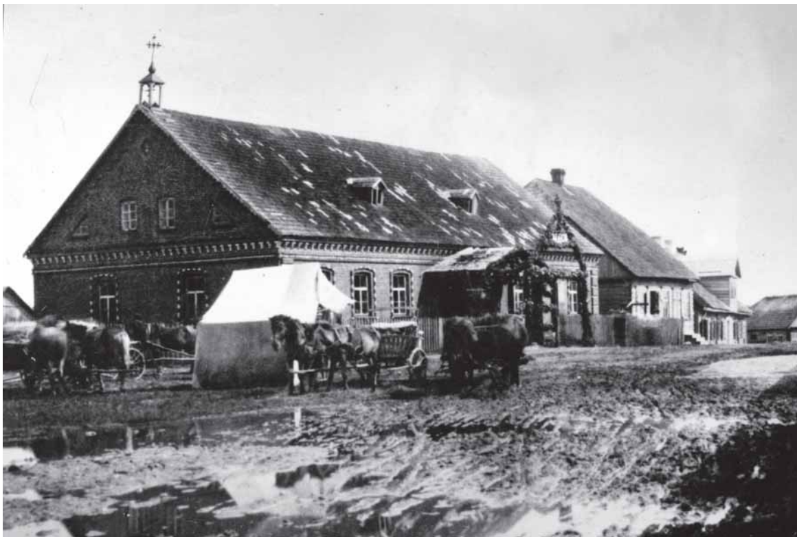
Betygala XX a. pradpioje.

Atsipraūdu, kad aš ne vietoje ir ne laiku taip ilgai pamokslavau. Gal pravers. Binau, kad pats naktimis sargauji – tūvelā pavaduoji.