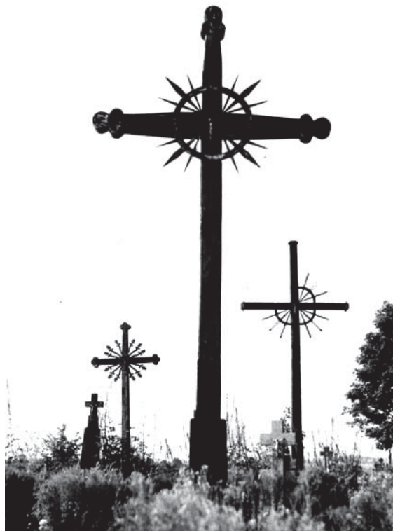
Nuotraukose (iš kairės): Betygalos kryžius ir betygalos kapinių kryžiai. 1966 m.