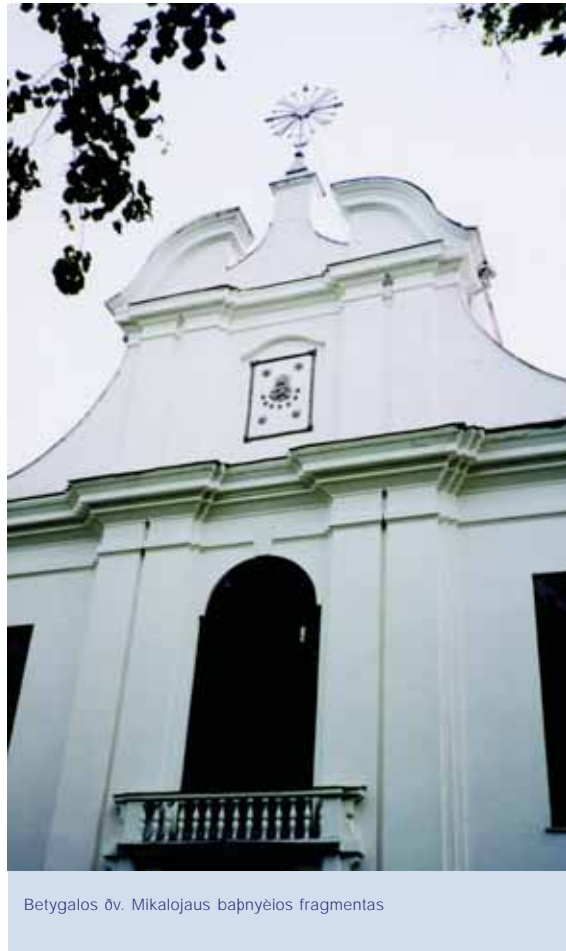
Betygalos dv. Mikalojaus bažnyčios fragmentas

Musiðkia buvo 27: 18 merginø ir 9 berniukai. Visuomeniniø politiniø „pėmės drebėjimø“ jie visi buvo iðblaðkyti po visà planetà. Po 52 metø, ko gero. paskutinià kartà pried iðvykdami Amžinatvėn susirinksiame pasirodyti, kà ið mūsø padarė Laikas. Smagu, graudu ir