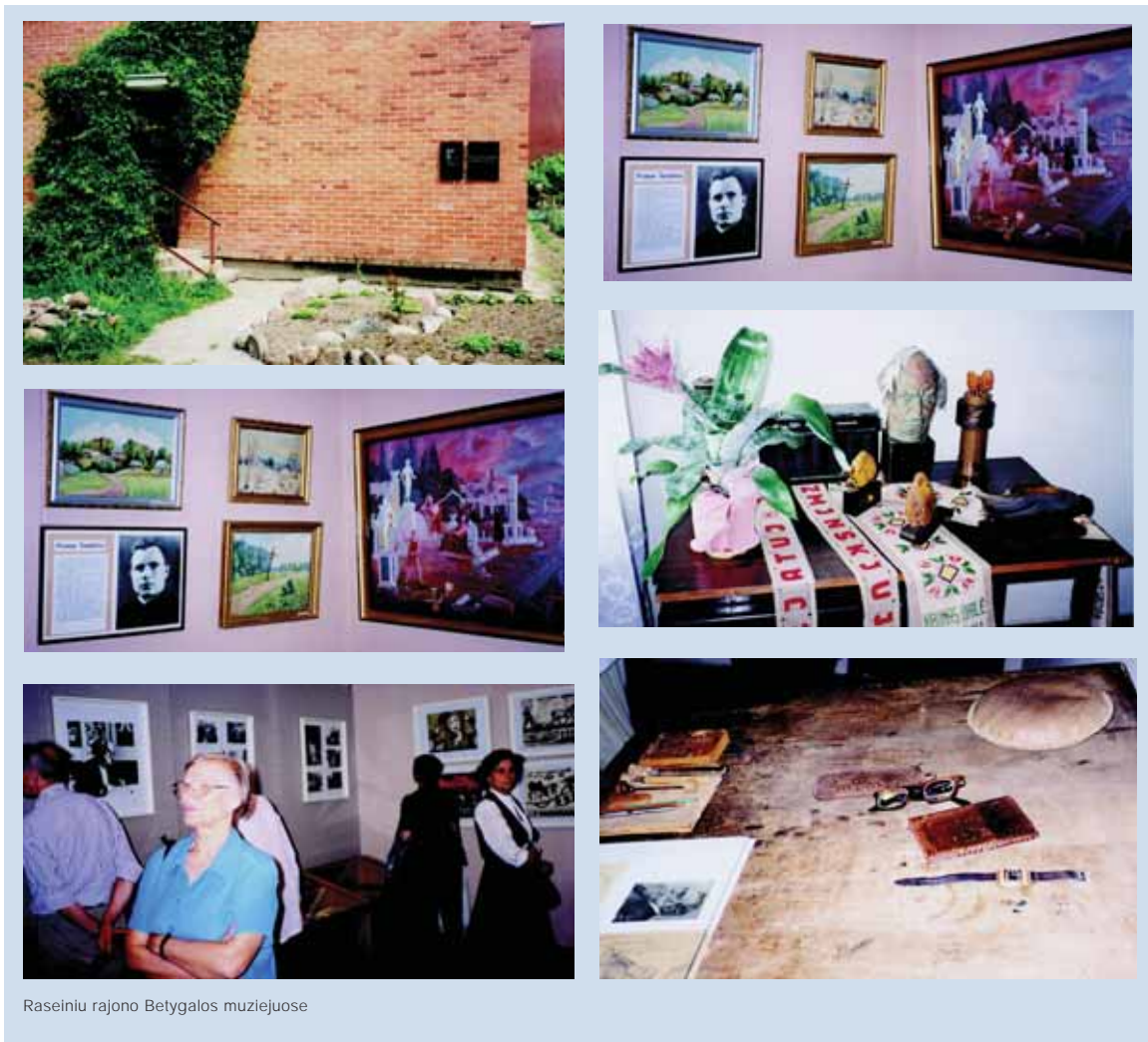
Raseiņu rajona Betygalos muzejjuose

kai nesusikalbēsime. Až gi ne tas karklelis, kuris nuo menkiausio vējelio siūbuoja pavējui. Klausau tik ārdies ir sāpinēs balso. Ir uļ nuopelnō pripapinimā, ir uļ darbō āvertinimā padēkojau... Neslēpsiu, buvo malonu... O protelis ānibpēdējo: „Kam tau tie visi dzinguliukai, ļaisliukai ? Uļteks to, kā uļgyvenai, juk ne su saule gyvensi“. Bet iāmintis patarinējo: „Jie reikalingi Betygalai, mūsō miesteliui garsinti, ļmonio ūpā kelti, ļadinti pasitikējimā. Juk gyvenimā nūgyventi, tai ne kepurē pakelti. Patyrimas – tarsi antras prigimimas. Pabuvau „ponu, pabuvau „draugu“ (net du kartus). Vēl – „ponu“. Pagaliau tapau ir padoriu pili e ēiu. “