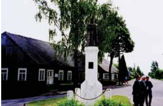
Betygalos Vytauto Didžiojo paminklas