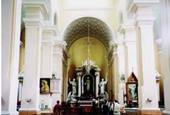
Betygalos dū. Mikalojaus bažnyčios vidaus fragmentas