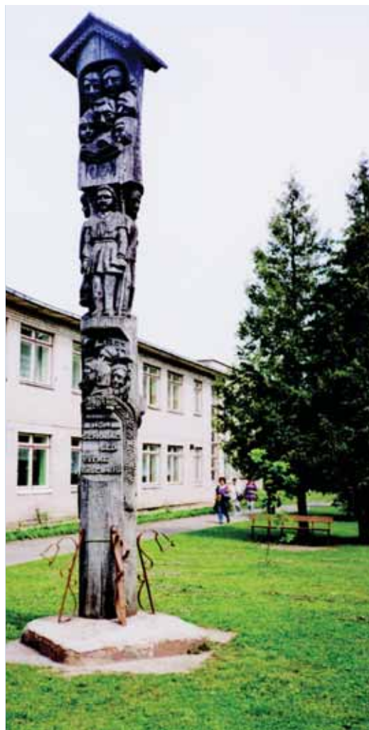
Stogastulpis prie Betygalos õMaironio vidurinės mokyklos

– O kas padarys? Senasis medis loviukas sutreðo. Tai prisirinkau akmenø, ðaligatviø plytø, sumûrijau, suklojau. Ant vienø suraðiau Maironio biografines datas, ant kitø – kûrinio iðleidimo metus... Kas smalsesnis, susigaudys, kã å tas plyteles sukiðau. Platesnis poveikio laukas. Þmonës dabnai pro istorinius ávykius praeina... Betygala savo hieroglifø neturi. O þenklo reikia. Tad viename sienelës ðone privirtino-me poeto posmã, kitame – uþraðã, jog paskutinã kartã Maironis eia lankësi 1931 m. liepos 28 d., kai buvo atvykæs å Onos atlaisdus... Paskui nuëjo å Padubysã. Ten, prie Åpuolytës, jã ir palydã pasitiko jaunimas –