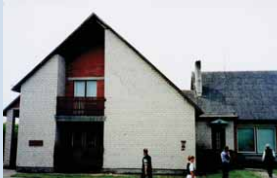
Raseiniu rajono Betygalos muziejuose