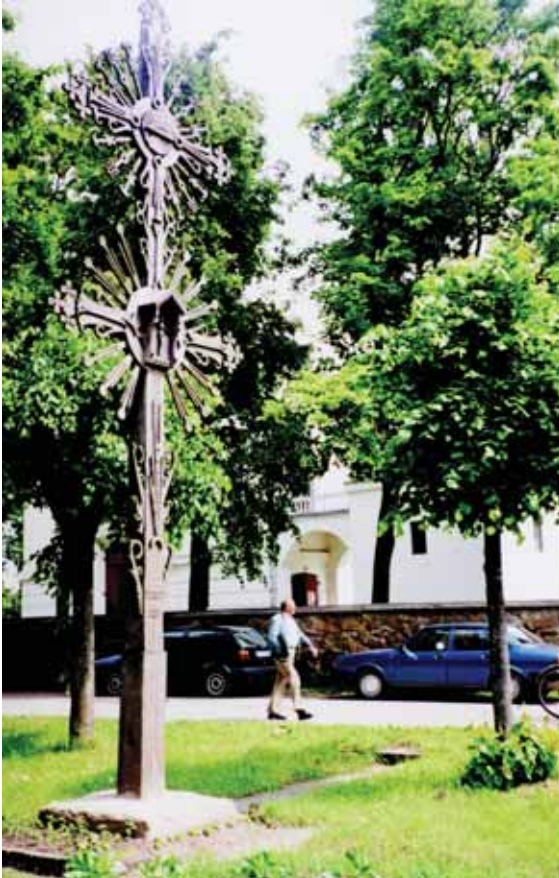
Krypius Betygalos dv. Mikalojaus baptynios šventoriuje