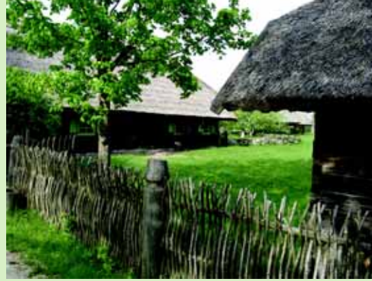
Lietuvos liaudies buities muziejaus ekspozicijos fragmentai.

aprašymas. Pasitelkiant paprotinę medžiagą, mįsles, patarles, priežodžius, dainų citatas, knygoje atskleidžiamas giluminis namų, tėviškės, kaip dvasios tvirtovės ir šventovės, suvokimas, pažįstamos, savos ir drauge paslaptingos vietos, kuriose gimė, ramiai ir saugiai gyveno ištisos kartos, globojamos protėvių ir visatos Kūrėjo.