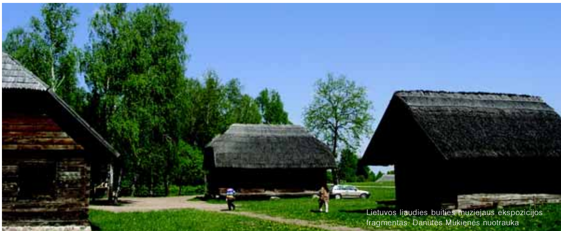
Lietuvos liaudies buities muziejaus ekspozicijos fragmentas.

Darbe naudotasi kraštotyrine, kita literatūra, taip pat Lietuvos literatūros ir tautosakos instituto Tautosakos rankraštyno bei Lietuvos istorijos instituto Etnologijos skyriaus, Lietuvos nacionalinio muziejaus archyvine medžiaga. Ačiū!“