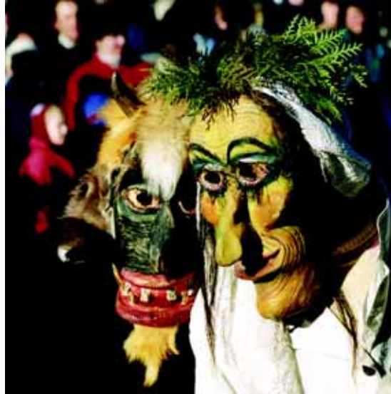
Žemaičių Užgavėnių kaukės.

Tokia pat neišvaizdi ir arklio galva – išpjauta iš lentgalio ar su-sukta iš šiaudų grįžtės. Kupiškėnai ją darydavę iš medžiagos: iš gelsvo audinio pasiūdavę riestą kaklą ir galvą, prikimsdavę šiaudų ar šieno ir pritvirtindavę prie pagalio, kurį apsižergdavęs „raitelis“. Labai populiarį gervę, tačiau sudėtingesnė jos kaukė žinoma tik iš Padubysio ir Šilalės apylinkių: per kailinių rankovę vaidintojas iškišdavo medinį kaklą ir galvą su kuodu; snapas judantis, kad galėtų lesti ir kapoti. Tuo tarpu kur kas dažniau būdavo per rankovę iškiša-ma ratelio verpstė su kotu, sukalti galais pagaliai, ar kartais ranko-se laikydavo per rankovę iškištą pagaliuką-snapą ir vis juo kapo-davo. Galimas daiktas, kad sudėtingesnėms gyvulių kaukėms pa-daryti trūkdavo laiko ir įgūdžių: juk dauguma persirengėlių kaukes gamindavosi kiekvienas sau.