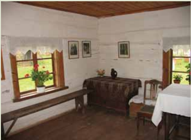
Kelmės rajono Ušnėnų kaime veikiantis Kelmės krašto muziejaus padalinys Povilo Višinskio memorialinis muziejus ir jo ekspozicijų fragmentai. 2010 m.

mįslingumas, galintis teikti naujų impulsų tyrinėjimams.