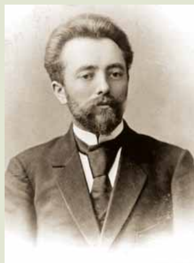
Kelmės rajono Ušnėnų kaime veikiančio Kelmės krašto muziejaus padalinio Povilo Višinskio memorialinio muziejaus ekspozicijos fragmentas ir Povilo Višinskio portretas