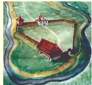
2 pav. (nuo viršaus): Palaimintasis Mykolas Giedraitis; Baltadvario maketas