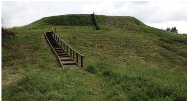
4 pav. Liesėnų (Bendrių) piliakalnis

Ypač didelis kunigaikščių Giedraičių giminės įnašas į Lietuvos dvasinį ir kultūrinį gyvenimą. Jau XV a. šeši Giedraičiai studijavo Krokuvos universitete. Žemaitijos apaštalu buvo vadinamas vyskupas Merkelis Giedraitis. Jis – aktyvus katalikų bažnyčios reformos Lietuvoje propagotojas, artimas Vilniaus vyskupo kardinolo Jurgio Radvilos bendradarbis, kanauninko Mikalojaus Daukšos globėjas, organizavęs ir finansavęs pirmųjų lietuviškų knygų, išleistų