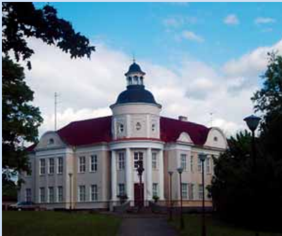
Telšių vyskupijos kurija