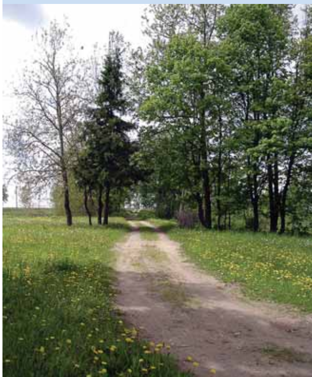
Pavirvytės dvaro sodybos (Telšių rajonas) fragmentai