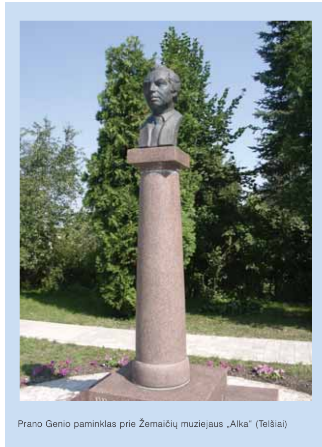
Prano Genio paminklas prie Žemaičių muziejaus „Alka“ (Telšiai)

1990 m. vasario mėnesį Telšių pavietas suorganizavo Prano Genio 88-ųjų gimimo metinių paminėjimą. Tą pačią dieną gražiai