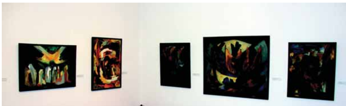
2011 m. Vilniaus paveikslø galerijoje veikusios Juozo Bagdono 100-meëiui skirtos parodos fragmentas.

namuose, vëliau jo parodos buvo eksponuojamos Filadelfijoje, Èikagoje, Detroite, Bostone, Hamiltone, Klivlande ir daugelyje kitø vietø. Tais paëiais metais dailininkas ásteigë prestiþinæ meno galerijà, kurioje rengë amerikieëiø dailininkø parodas. Galerija veikë iki 1963 metø. Na o 1964-aisiais dailininkas persikëlë á Niujorkà. Èia jis ásijungë á lietuviø bendruomenës kultûrinæ veiklà, dirbo organizacinæ darbà, dalyvavo Niujorko Baltijos dailininkø sàjungos „Baltia“ veikloje.