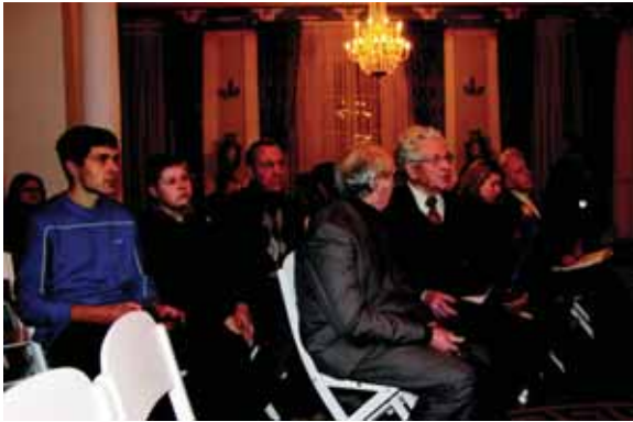
2011 m. gruodþio 15 d. Vilniaus paveikslø galerijoje ávykusio J. Bagdono 100-meëiui skirtø kultūros vakaro akimirka.