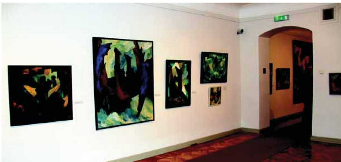
2011 m. Vilniaus paveikslø galerijoje veikusios Juozo Bagdono 100-meėiui skirtos parodos fragmentas.