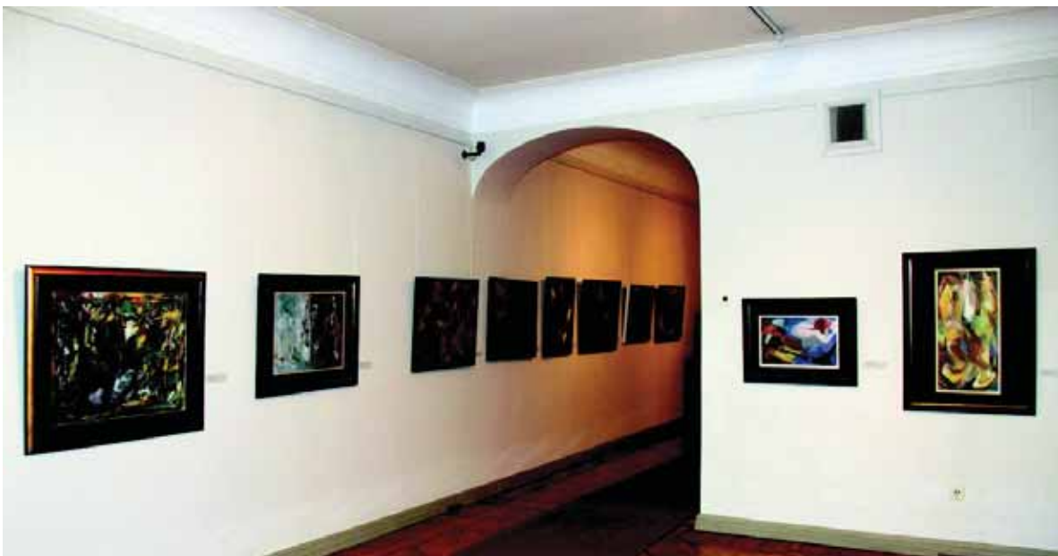
2011 m. Vilniaus paveikslo galerijoje veikusios Juozo Bagdono 100-meëiui skirtos parodos fragmentas.