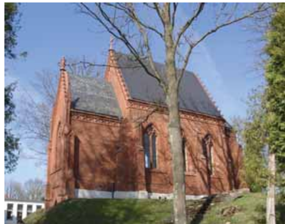
Grafų Tiškevičių koplyčia Kretingos senosiose kapinėse.

Legendiniu Kretingos kūrėju laikomas gotų karalius Armonas, kilęs iš Grutingo giminės. Teodoras Narbutas teigia, kad tautų kraus- (Nukelta iš 8 p.)