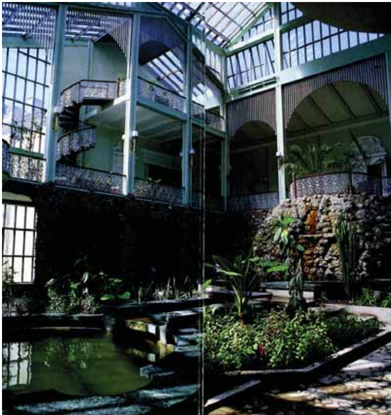
Kretingos dvaro rūmų piemos sodas.