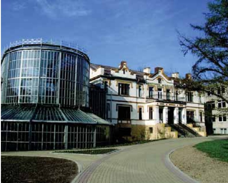
Kretingos dvaro rūmai su vakarinėje pusėje esančiu Piemos sodu.