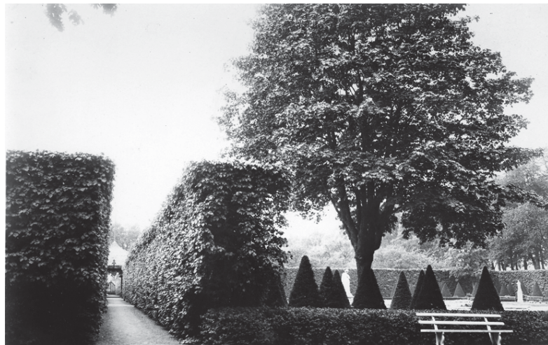
lð kairės: paminklinis akmuo, kuris þenklinia vietà, kurioje stovės paminklas Kretingos miesto ákurėjui Jonui Karoliui Chodkeviėiui; Kretingos davro parkas XX a. pr.