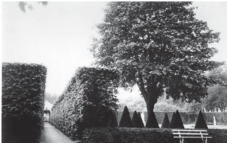
lð kairės: paminklinis akmuo, kuris þenklinia vietà, kurioje stovės paminklas Kretingos miesto ákurėjui Jonui Karoliui Chodkeviėiui; Kretingos davro parkas XX a. pr.