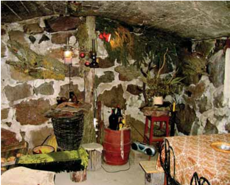
Vidos ir Vinco Stankūno pėmaitiokje sodyboje (Dėauliė rajonas).