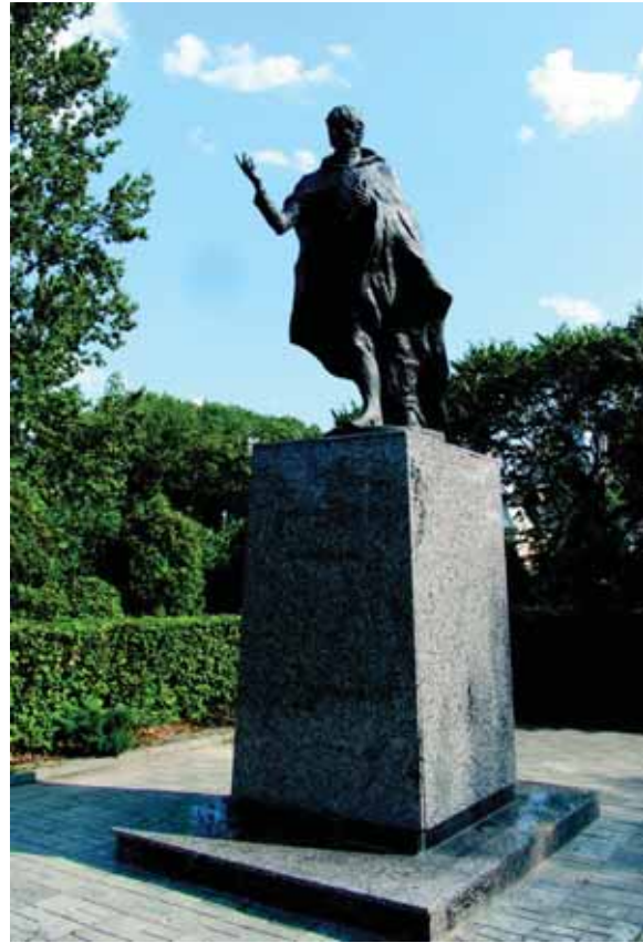
Paminklas Mykolui Kleopui Oginskiui Guzove. Skulptorius

Iki 2013 m. buvusioje karietinèje planuojama àrengti kultŭros centrà, kuriame bus galima orga-