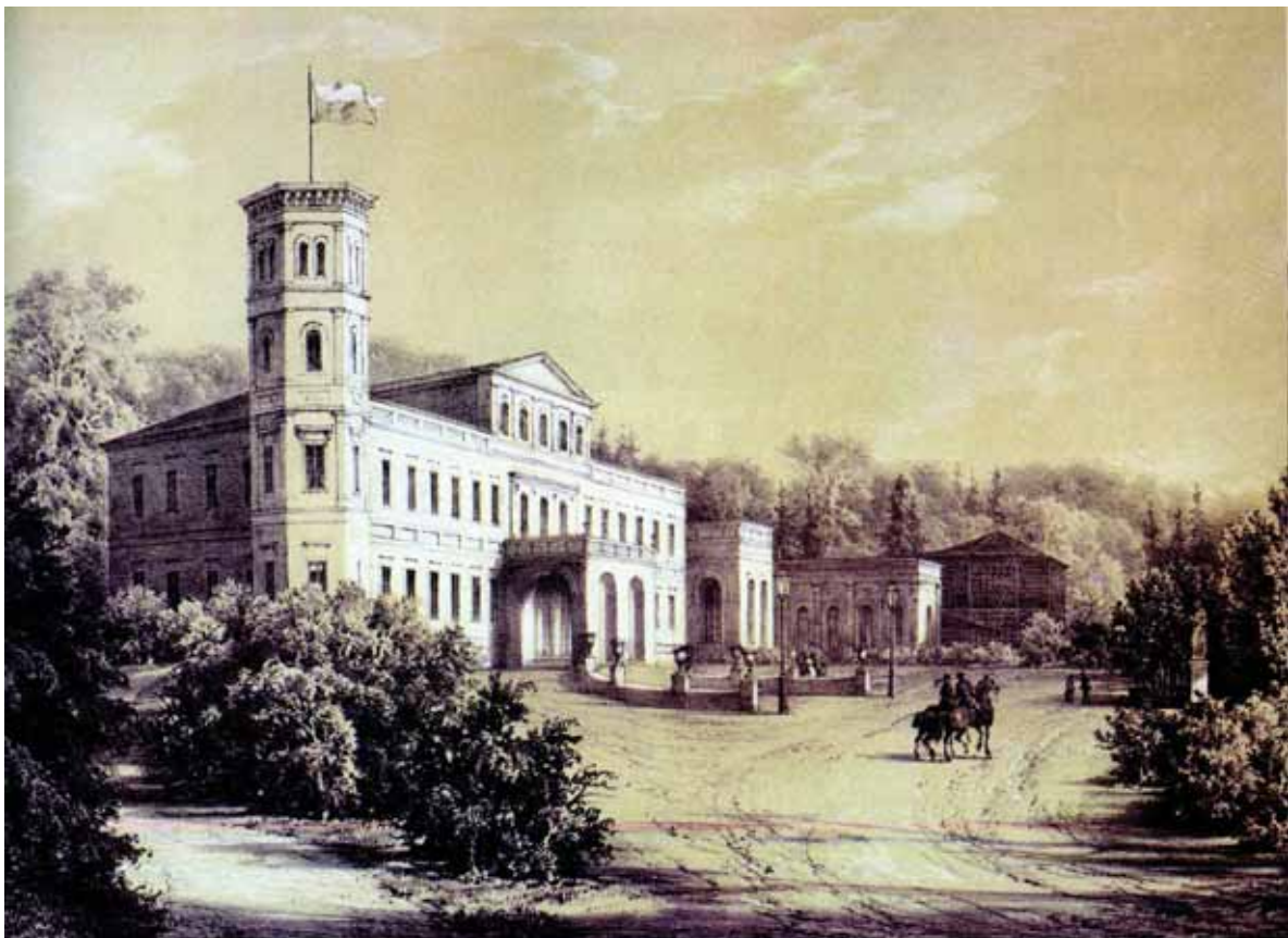
Rietavo Oginskių rūmai XIX a. pabaigoje. Napoleono Ordos piešinys

Rezoliucijoje papymėta, kad ši sutartis yra atvira visoms suinteresuotoms institucijoms, organizacijoms ir asmenims, kurie pritaria esminėms rezoliu-