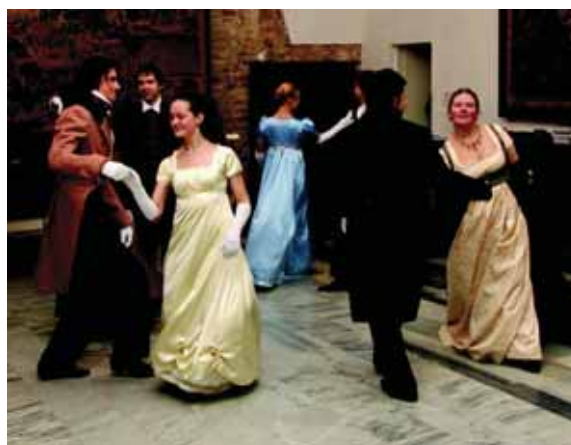
ėoka jaunimo visuomeninio susivienijimo „Historika“ (Minskas) jaunimas M. K. Oginskio laikotarpio ėokius.

12. parengti ir ėgyvendinti Lietuvoje saugomo M. K. Oginskio ir jo palikuoniė, jė artimėjė raėytinio palikimo tyrimė, skaitmeninimo ir vieėinimo programā;