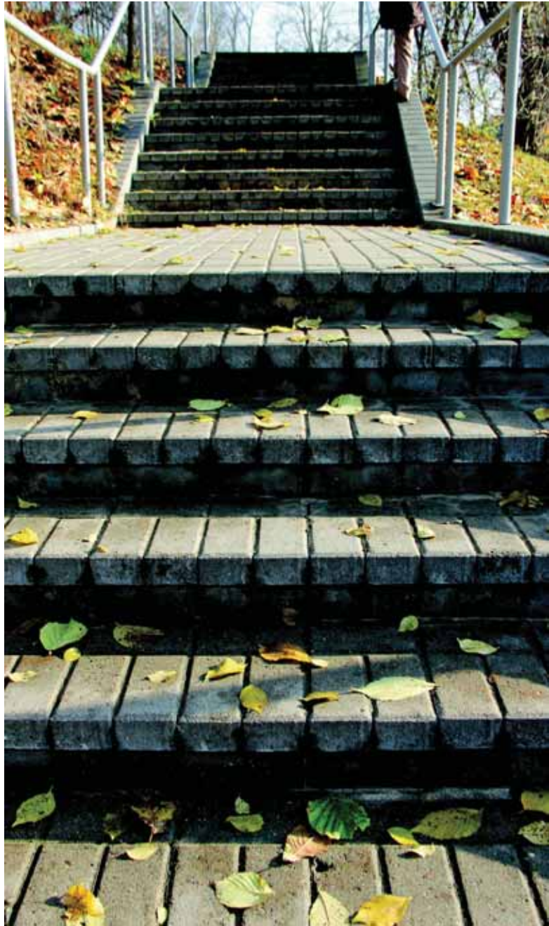
Rodou. Mukienēs Danutēs portēgrapējē

Vingiouts takieli, sugierēs daugībēs þingsniu aida, ar rçktom tava vingius laikītē oþ klaida? Gal pērmāsis keleivis kelē ēiðkuojē sausa, vuo rasiēt skobiejē, nuoriedams nuçtē tēisiauç. Rast' nanuoriejē primintē þuolīna a krūma ēr pasoka aplinkou