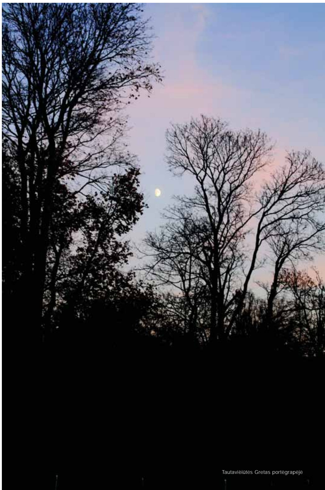
Tautavieliūtės Gretas portėgrapjė