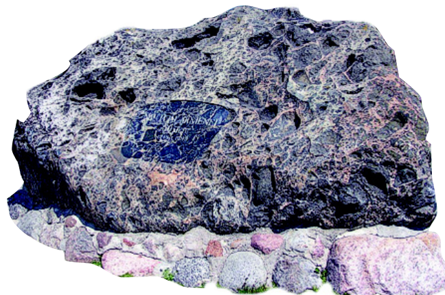
Paminklinis akmuo Naujojoje Akmenėje, skirtas miesto įkūrimo 50-mečiui

1897 m. Akmenėje buvo apie 1,5 tūkst. gyventojų.