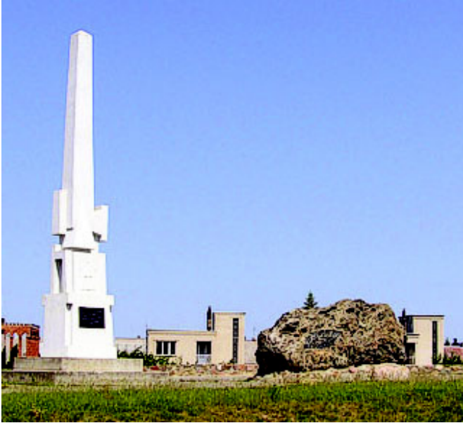
Naujosios Akmenės skvero, kuriame stovi obeliskas ir paminklinis akmuo, skirtas miesto įkūrimo 50-mečiui, fragmentas