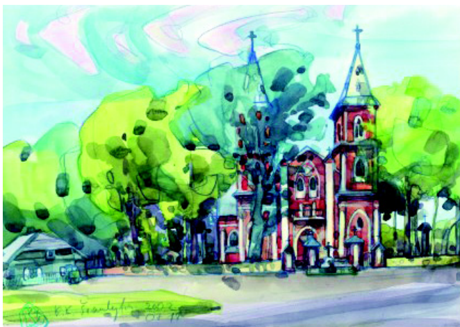
Kęstutis Šiaulytis. Papilės bažnyčia. 2002m., akvarelė, pieštukas, 29,7 x 42 cm

Kitas Papilės piliakalnis – dešiniajame Ventos upės krante. Tai – Pašalpos kalnas. Toje vietoje į Ventą taip pat seniau įtekėdavo nedidelis upelis. Tiek vieno, tiek kito pavadinimai nežinomi. Šis piliakalnis – tarsi natūraliai susiformavęs iškyšulys. Jo šlaitai statūs ir aukšti (iki 13 m aukščio). Piliakalnio viršūnėje anksčiau būta aikštelės. Rytinėje dalyje buvusios priešpilio aikštelės ilgis – 30 m, plotis – 28 metrai. Šio piliakalnio teritorijoje