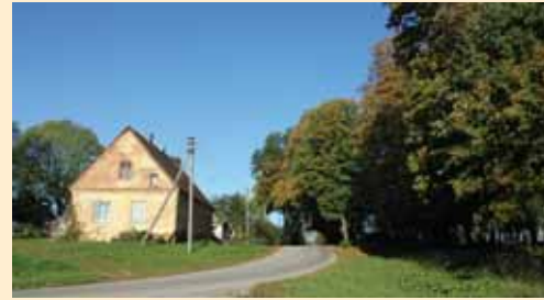
Buvusio Lomių dvaro sodyba (išlikęs XX a. pr. namas, parko fragmentas ir atstatytas XIX a. pab.–XX a. pr. svimas) prie kelio Lomiai–Šakvietis