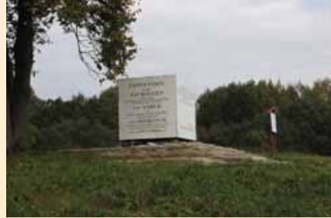
Paminklai, ženklinantys buvusio Tauragės dvaro Požerūnų malūno vietą, kurioje 1812 m. gruodžio 30 d. buvo pasirašyta konvencija tarp Napoleono sąjungininko, Prūsijos armijos korpuso generolo leitenanto Johano Davido Liudviko Jorko von Vartenburgo ir Rusijos armijos generolo majoro Ivano Ivanovičiaus Dibičiaus. Šis dokumentas dėl tarpusavio neutraliteto padarė didelę įtaką tolimesnei Europos istorinei raidai. Napoleonas Bonapartas apie šią konvenciją yra pasakęs: „Tai skaudžiausia, kas galėjo įvykti ne tiek kariniu, kiek politiniu požiūriu.“ 2010 m.