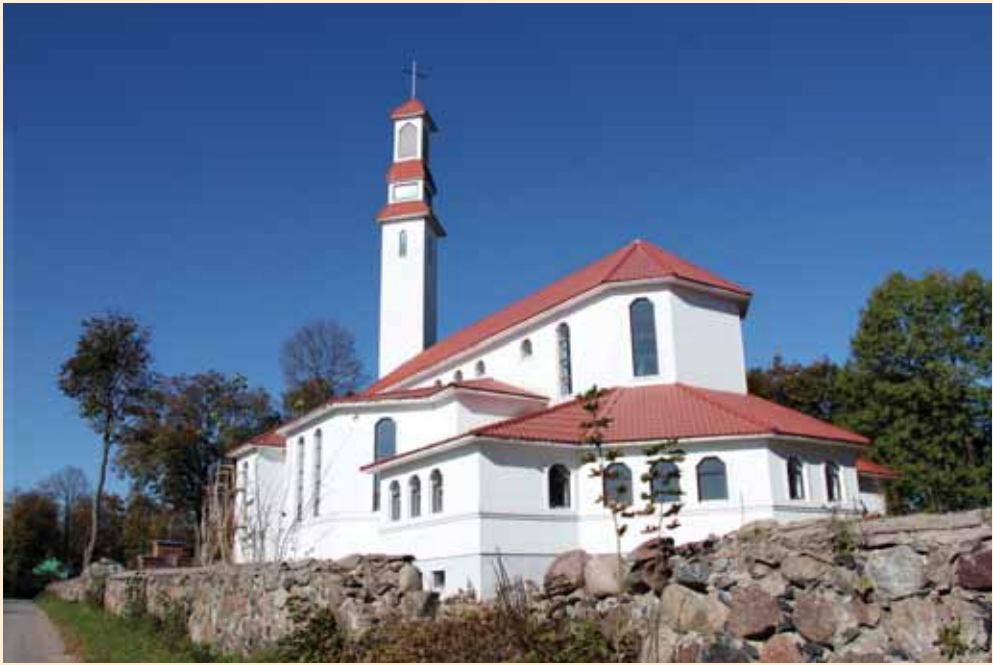
Baigiama atstatyti Gaurės katalikų bažnyčia. Architektas Stasys Prikockis. 2010 m.