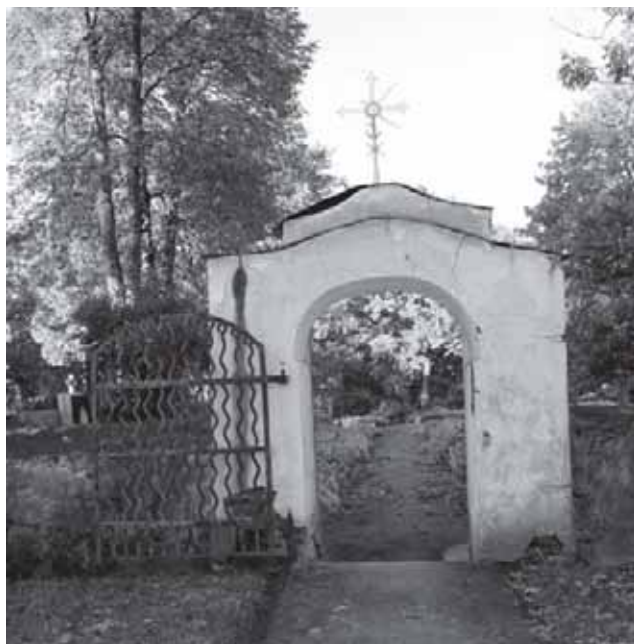
Adakavo katalikų bažnyčios šventoriaus vartai

1923 m. Adakave buvo 289 gyventojai, 1959 m. – 362, 1970 m. – 617, 1989 m. – 680, 2001 – 617. Adakavo parapija 1938 m. (tada ji priklausė Tauragės dekanatui) vienijo 1 546 katalikus.