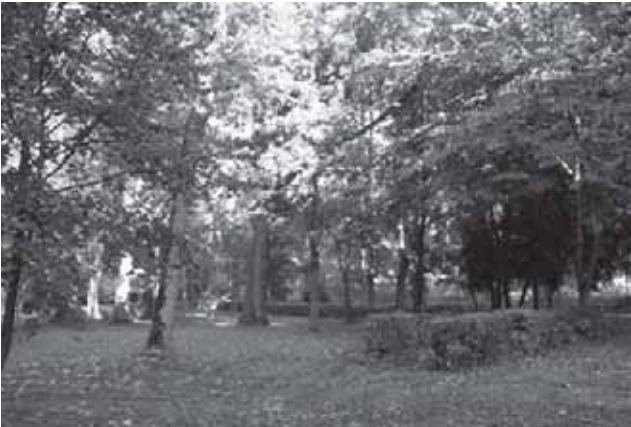
Buvusios Adakavo dvaro sodybos parkas įsiterpęs tarp dvaro centrinių rūmų ir bažnyčios

negu bažnytiniai. Spėjama, kad jie, prieš atvežant į bažnyčią, galėjo būti naudojami greta stovėjusiame Adakavo dvare. Vargonai įrengti galiniame Adakavo bažnyčios balkone. Jie labai kompaktiški, nedideli. Ant choro tvorelės krašto anksčiau buvo sumontuotas tapytas skydas, vaizduojantis rokokinių vargonų fasadą. Vargonai yra išlikę beveik autentiški. Jų restauravimo metu (1986 m.) pakeistos tik dumlės (naujasias pagamino UAB „Vilniaus vargonų dirbtuvė“).