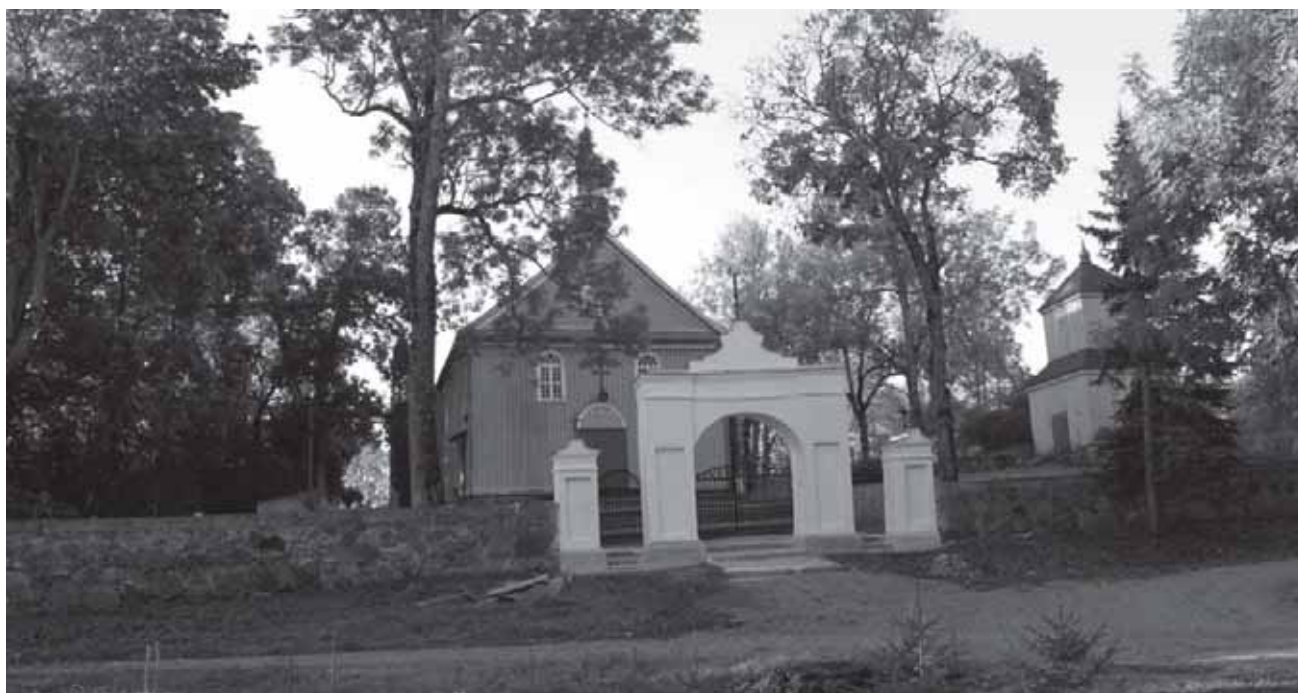
Adakavo šv. Jono Krikštytojo bažnyčios ansamblis

Iki šiol garsūs Adakavo bažnyčios vargonai. Juos XVIII a. II p. sukūrė nežinomas meistras (spėjama, kad jis buvo iš Rytprūsių). Anot vargonų specialistų, Adakavo vargonai daugiau saloniniai,