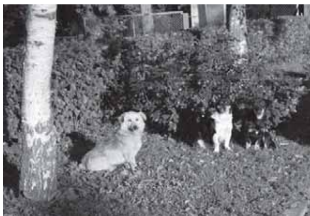
Adakavo dvaro sodybos lankytojus įdėmiai stebi ir tokie jos gyventojai...