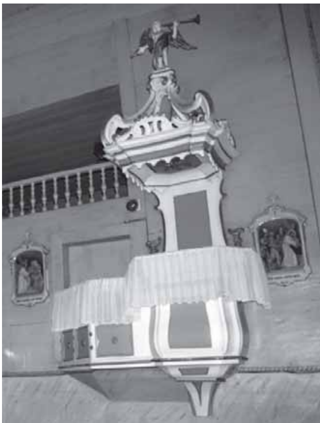
Nuotraukose – Adakavo bažnyčios sakykla ir altoriai

mai, kuriuose gyvena žmonės su psichine ir proto negalia.