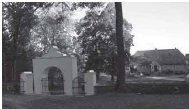
Adakavo šv. Jono Krikštytojo bažnyčia, šventoriaus vartai, šalia stovinys pastatai