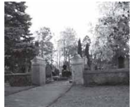
Kairėje – rekonstruoti, socialiams globos namams pritaikyti Adakavo dvaro sodybos centriniai rūmai. Viršuje – šalia Šv. Jono Krikštytojo bažnyčios esančių Adakavo kapinių vartai. Apačioje – Adakavo dvaro parko fragmentas ir bažnyčios vargonėliai (viršuje)