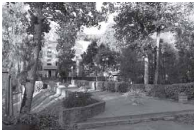
Medžių alėja, vedanti link rekonstruotų Adakavo dvaro sodybos centrinių rūmų, kuriuose dabar veikia socialiniai globos namai