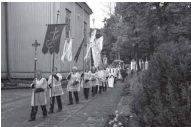
Viršuje ir dešinėje – Skaudvilėje jubiliejaus dienomis aukotų Šventų Mišių ir procesijos, kuri buvo einama apie Skaudvilės Švento Kryžiaus bažnyčią, akimirkos bei stogastulpio, skirto Skaudvilės 250 metų jubiliejui, fragmentas