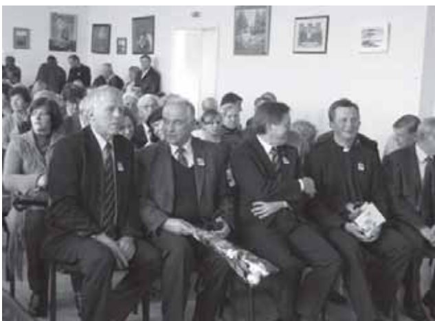
Viršuje – lankytojai apžiūri Skaudvilės seniūnijoje veikusią ekslibrisų parodą. Apačioje – šventinių renginių dalyviai