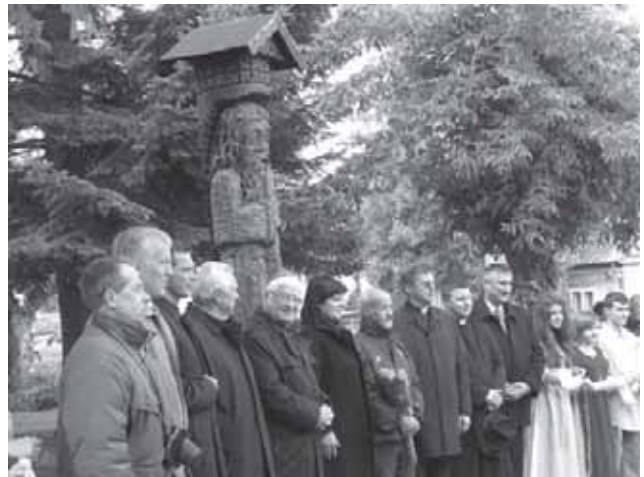
Medžio skulptūros, skirtos Skaudvilės 250 metų jubiliejui, atidengimo ceremonijos akimirka