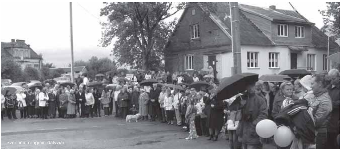
Šventinių renginių dalyviai