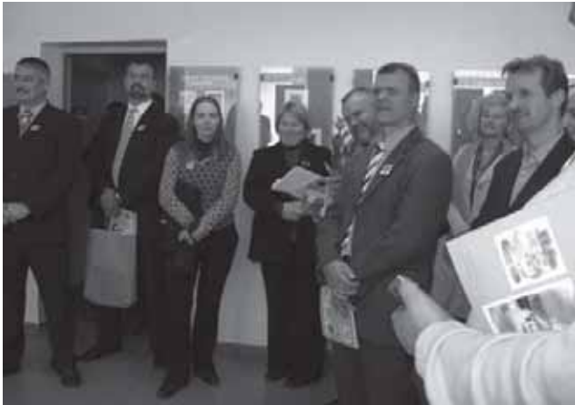
Skaudvilės jubiliejui skirtos tarptautinės ekslibrisų parodos atidarymo dalyviai