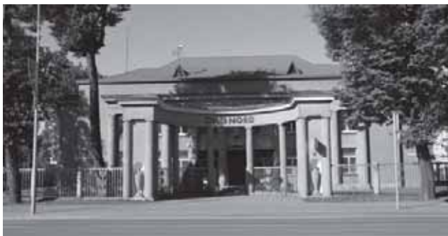
Tauragės banko pastato priekinis fasadas (architektai A. Funkas ir M. Songaila, pastatytas 1935 m.)

Miesto pavadinimas sudėtas iš dviejų žodžių – tauras ir ragas. Senovėje šiose apylinkėse plytėjo didžiuliai miškai, juose augo tau-