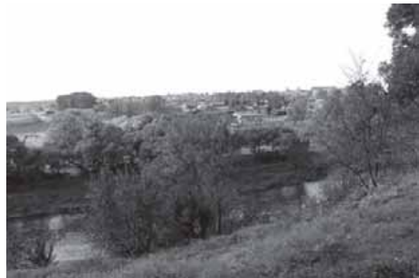
Tauragės miesto apylinkių vaizdas nuo Jūros upės pusės