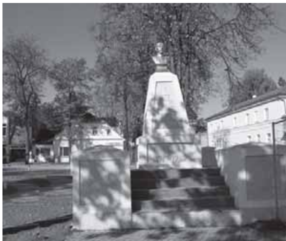
Centrinis Tauragės miesto skveras