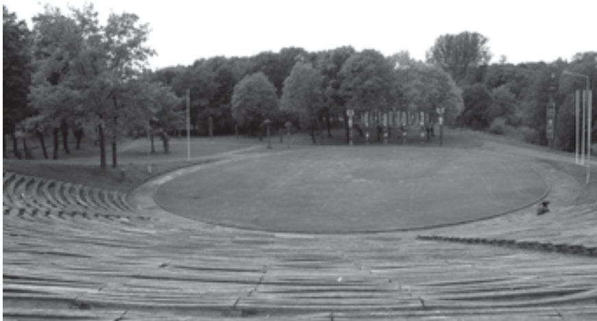
Viršuje – Tauragės miesto ligoninė nepriklausomos Lietuvos metais buvo viena moderniausių gydymo įstaigų šalyje. Jos projektą parengė architektas A. Reisonas. Apačioje – Jūros upės slėnyje įrengto Tauragės parko, vasaros estrados fragmentas

1923 m.). Ji turėjo rengti mokytojus ir Mažajai Lietuvai. Iki 1933 m. vasaros mokyklą baigė 163 auklėtiniai. 1941 m. naciai uždraudė priimti mokinius į seminarijos pirmąjį kursą, o 1942 m. seminarija buvo uždaryta.