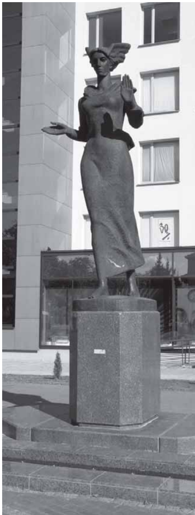
Skulptūra „Taika“ Tauragės miesto centre. Skulptoriai Leonas ir Gediminas Žukliai, architektas Eduardas Budreika