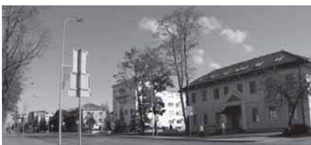
Tauragės miesto centras. Dariaus ir Girėno gatvė, senasis Tauragės paštas

XVI a. Tauragė jau buvo minima daugelio užsienio šalių rašytiniuose šaltiniuose.