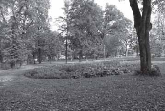
Tauragės miesto parko prie Tauragės evangelikų liuteronų Martyno Mažvydo bažnyčios fragmentas

yra veikusi muitinė, kalėjimas, psichiatrijos, apskrities ligoninė. Dabar pastatų kompleksas naudojamas kultūros reikmėms, čia veikia krašto muziejus. Pilies ansamblis užbaigtas suformuoti 1886 metais.