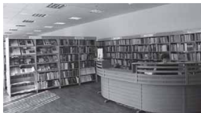
Tauragės rajono savivaldybės viešoji biblioteka