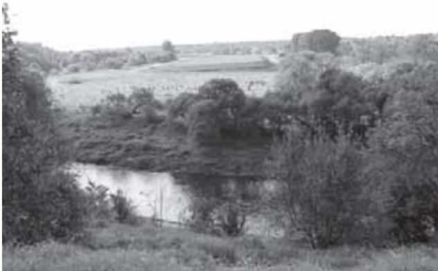
Tauragės miesto apylinkių vaizdas nuo Jūros upės pusės