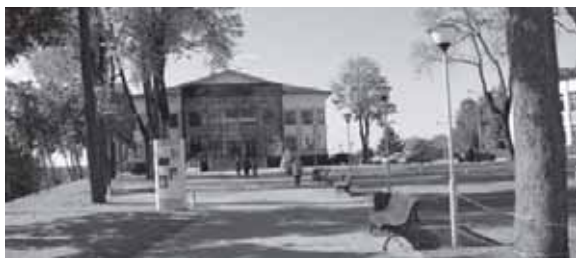
Tauragės kultūros rūmai