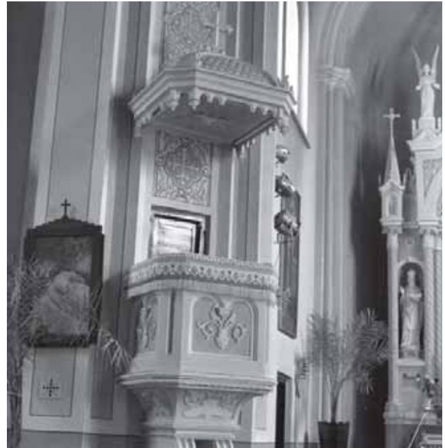
Tauragės katalikų bažnyčios altoriai. 1966 m.