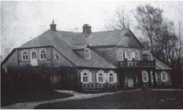
Norčiškės dvaro centrinis pastatas („ponų namas“) XX a. 4 dešimtmetyje.