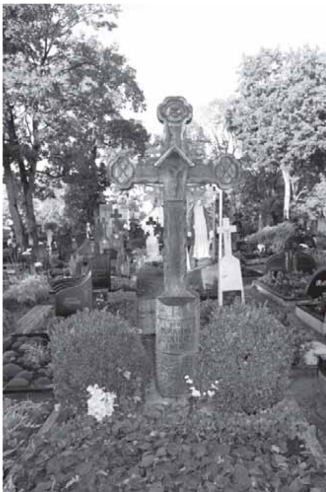
Kryžius žuvusiems už Lietuvos laisvę Skaudvilės kapinėse