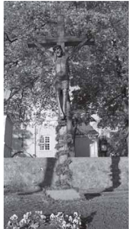
Nuotraukose (iš kairės): Skaudvilės katalikų varpinė; paminklas Skaudvilės katalikų bažnyčios šventoriuje 1914–1920 m. karo aukoms atminti; Kryžius su Nukryžiuotojo skulptūra (aut. Pranas ir Tomas Šauliai) prie Skaudvilės katalikų bažnyčios šventoriaus