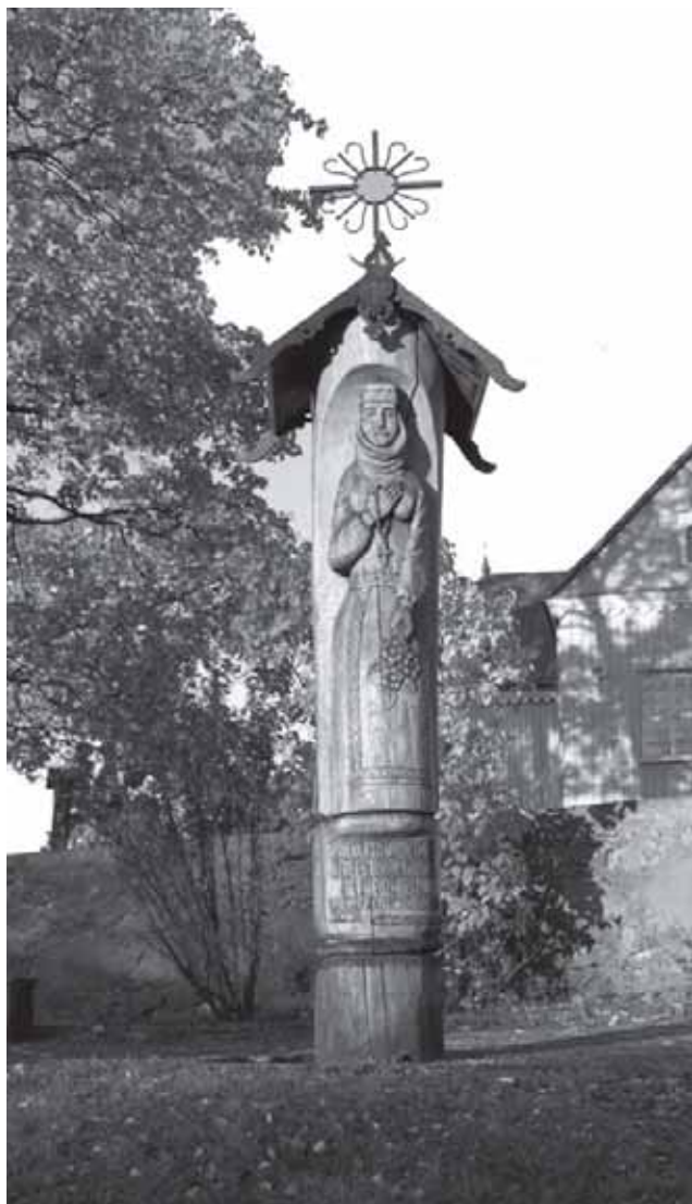
Kairėje – paminklas 1941–1952 m. aukų atminimui įamžinti Skaudvilėje (Atkelta iš 47 p.)

1937 m. atidaryta Skaudvilės viešoji biblioteka.