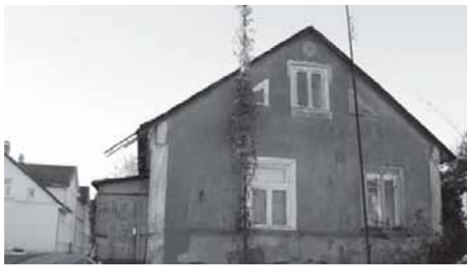
Iš kairės: buvęs Skaudvilės žydų sinagogos pastatas ir buvęs Skaudvilės žydų gyvenamasis namas. 2010 m.