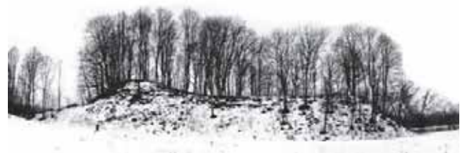
Ivangėnų piliakalnis.

kalnio šlaitų jau buvo nuslinkęs ir, atseit, matėsi į piliakalnio rūsius vedančios durys.