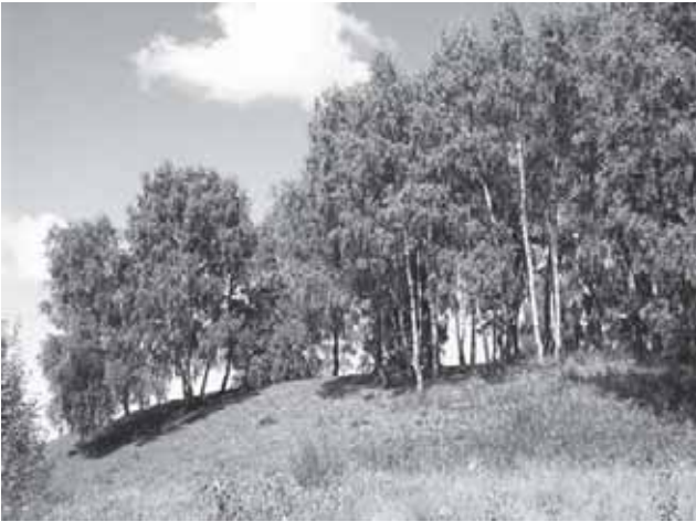
Skaudvilės (Nosaičių, Pilės) piliakalnis