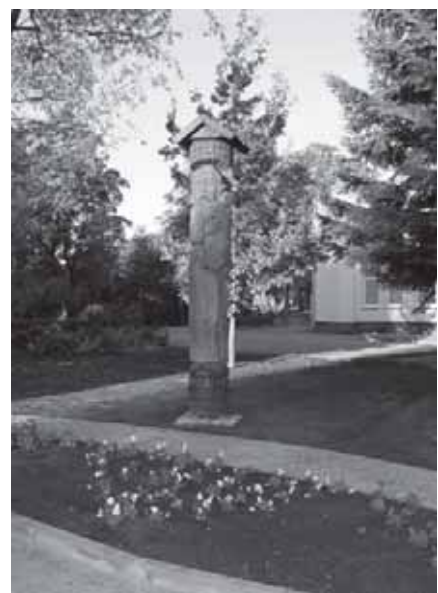
Nuotraukose apačioje (iš kairės): Skaudvilės Švento Kryžiaus bažnyčia; paminklas žuvusiems už Lietuvos laisvę Skaudvilės kapinėse; paminklas, kuriuo 2010 m. įamžinas Skaudvilės 250 metų jubiliejus