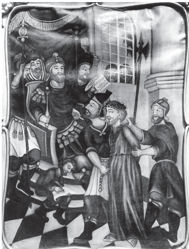
Skaudivilės Švento Kryžiaus bažnyčios viena iš Kelio kryžiaus stočių 1966 metais.

1910 m. pastatyta medinė Skaudivilės gaisrinė.