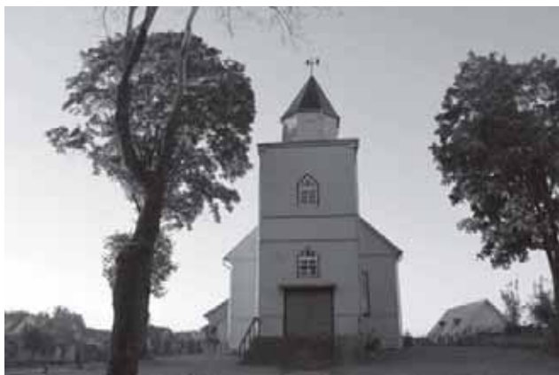
Skaudivilės evangelikų liuteronų bažnyčia

1918 m. kurį laiką Skaudivilė buvo apskrities centras (iki 1919 m. liepos 31 d.). 1918 m. gruodžio mėnesį įvyko Skaudivilės apskrities pirmasis parapijinių komitetų, veikusių Girdiškėje, Kaltinėnuose, Karklėnuose, Kelmėje, Kražiuose, Laukuvoje, Nemakščiuose, Pa-