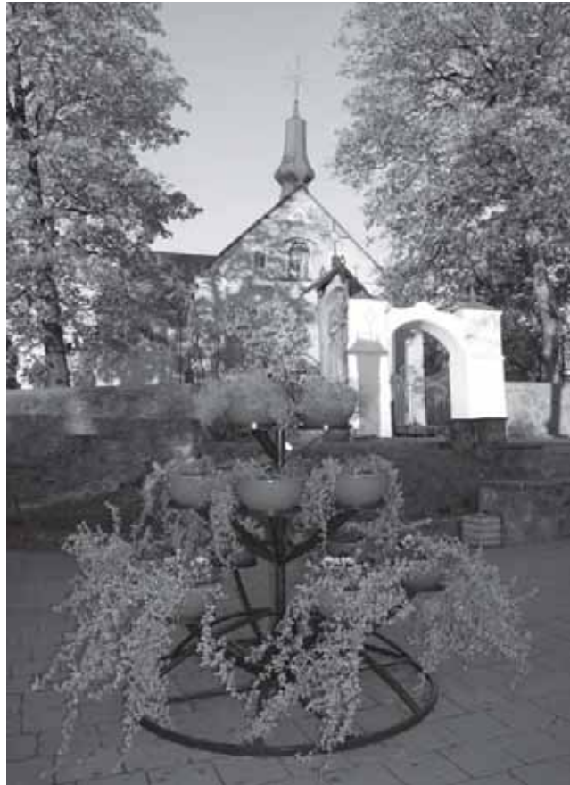
Skaudvilės Švento Kryžiaus bažnyčios architektūrinis ansamblis

Skaudvilės seniūnijos teritorijoje dabar veikia dvi katalikų (Skaudvilėje ir Adakave) bei viena evangelikų liuteronų bažnyčia (Skaudvilėje). Skaudvilėje veikia gimnazija ir specialioji mokykla, palaikomojo gydymo ir slaugos ligoninė. Adakave yra pagrindinė mokykla ir socialiniai globos namai. Iš viso seniūnijos teritorijoje veikia treji kultūros namai.