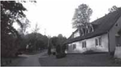
Nuotraukose (viršuje, apačioje ir dešinėje) – Lakštingalų slėnio poilsiavietės (Mažonų seniūnijos Alijošiškių kaimas) vaizdai