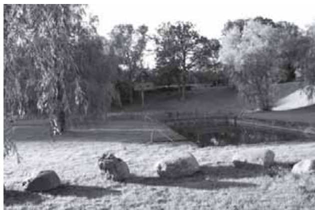
Lakštingalų slėnio poilsiavietės (Mažonų seniūnijos Alijošiškių kaimas) vaizdai