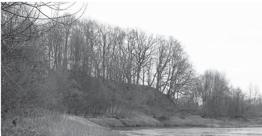
Matiškių piliakalnis ant Jūros upės kranto