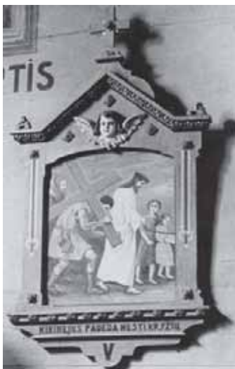
Viena iš Gaurės bažnyčioje buvusių Kryžiaus kelio stočių. Fotografuota 1964 m.