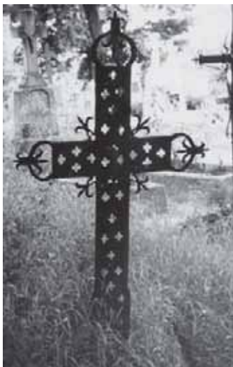
Gaurės kapinių geležiniai kryžiai. Fotografuota 1964 metais