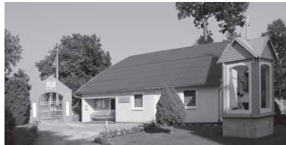
Tenenių šv. Barbaros bažnyčios šventoriuje