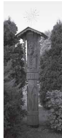
Iš kairės: varpinė, koplytėlė ir Švč. Mergelės Marijos su Vaikeliu skulptūra Tenenių bažnyčios šventoriuje; koplytstulpis Teneniuose