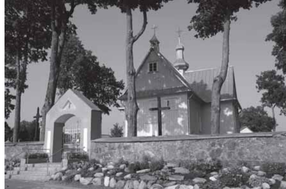
Tenenių šv. Barbaros bažnyčia ir ją juosianti mūro tvora

Šiandien tai jauki, tvarkinga gyvenvietė. Vasarą čia džiugina gražūs gėlynai, skoningai tvarkoma pagrindinės mokyklos aplinka ir bažnyčios šventorius. Kaip ir daugelį kitų Žemaitijos krašto miestelių, jį puošia tradiciniai šio krašto kryžiai. Gyvenvietėje stovi ir didelė balta mūrinė koplyčia.