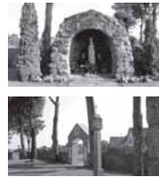
Tenenių lurdas, Šv. Barbaros bažnyčios šventorius, Tenenių kryžius ir balto mūro koplyčia