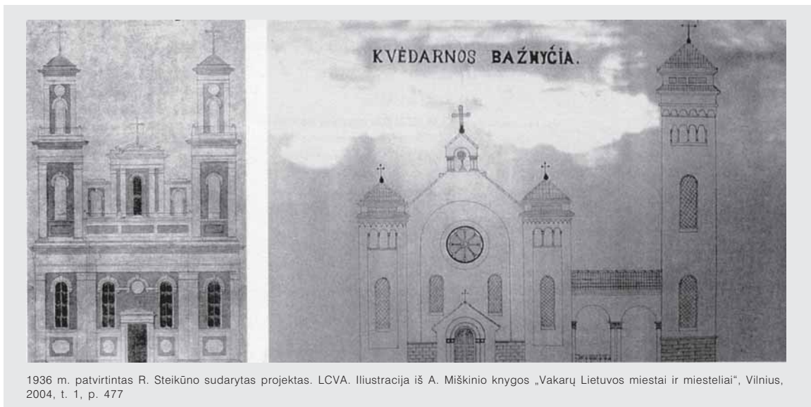
1936 m. patvirtintas R. Steikūno sudarytas projektas. LCVA. Ilustracija iš A. Miškinio knygos „Vakarų Lietuvos miestai ir miesteliai“, Vilnius, 2004, t. 1, p. 477

tesnė varpinė dviejų arkų galerija prijungta fasado dešinėje pusėje. Ji kvadratinio plano, vientiso tūrio. Plynas varpinės sienas skaido segmentinių sąramų langai, kurių kiekvienoje yra po du. Varpinės viršutinė dalis atkartoja bažnyčios bokštų viršūnes. Toks sprendimas tuo metu Lietuvoje buvo gana retas.