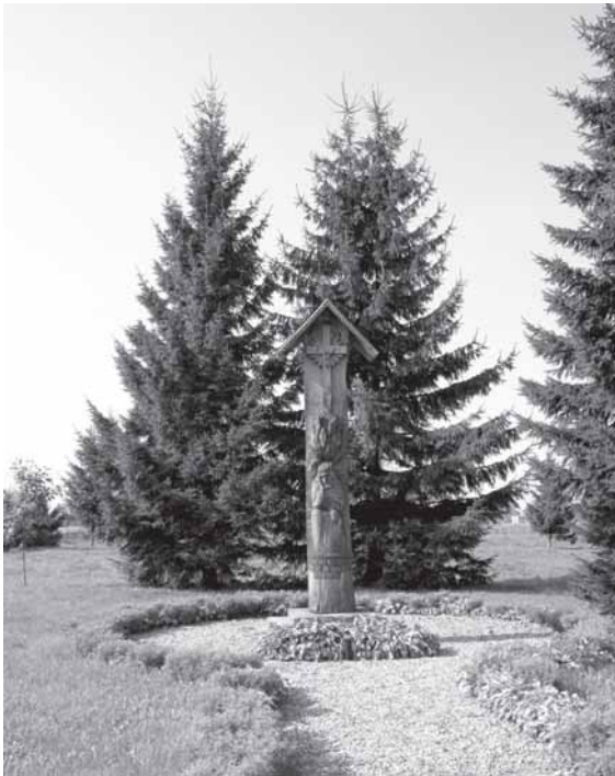
Koplytstulpis Kvėdarnoje, skirtas žuvusiems tremtyje ir tėvynėje 1940–1953 metais