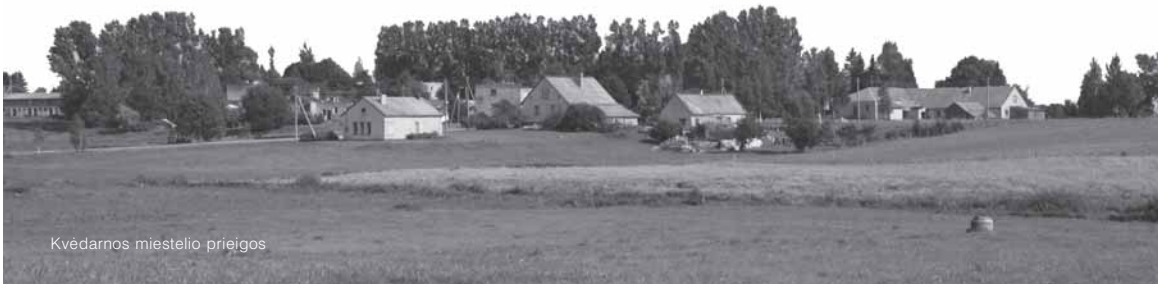
Kvėdarnos miestelio prieigos