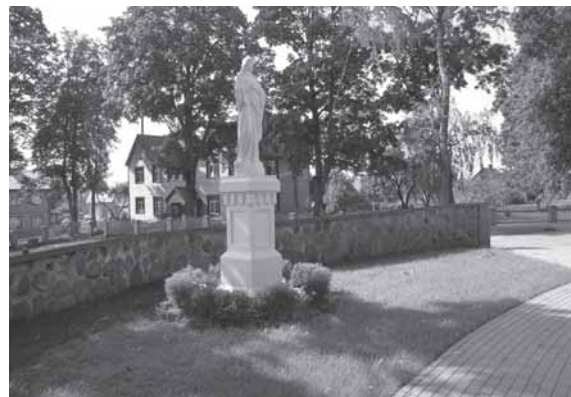
Švč. Mergelės Marijos skulptūra Kvėdarnos šventoriuje