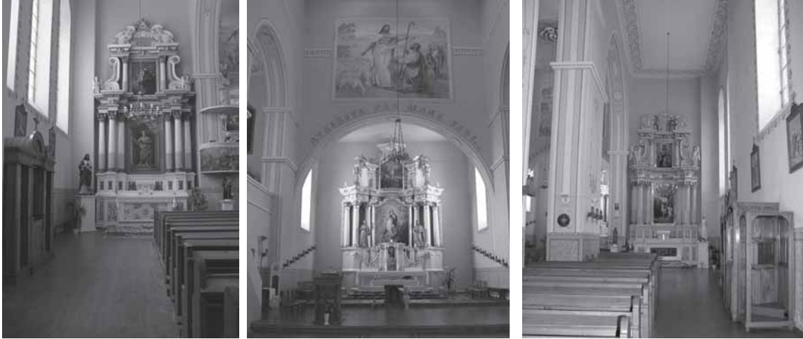
Kvėdarnos Švč. Mergelės Marijos Nekalto Prasidėjimo bažnyčios altoriai