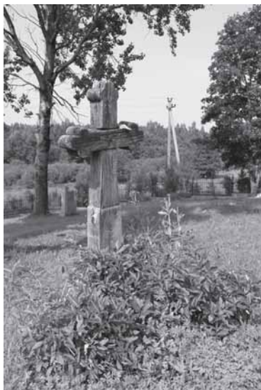
Kryžius Požerės kapinėse

Tegu atsigers vandens. Už miškų griaustinis dunda. Miras tarsi atsibunda. Patrina ranka sau kaktą Ir staiga apstulbęs mato: Ežere mergaitė braido, Bangeles žaismingai sklaido. Balto lino rūbas ilgas, O pati liauna kaip smilga. Ne, ne smilga, o nendrelė, Ežero vėsi bangelė.