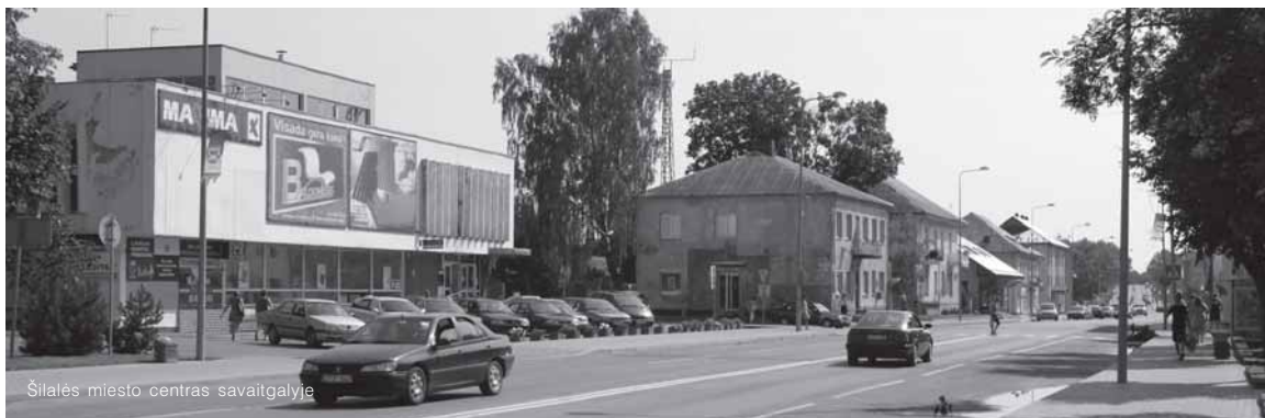
Šilalės miesto centras savaitgalyje