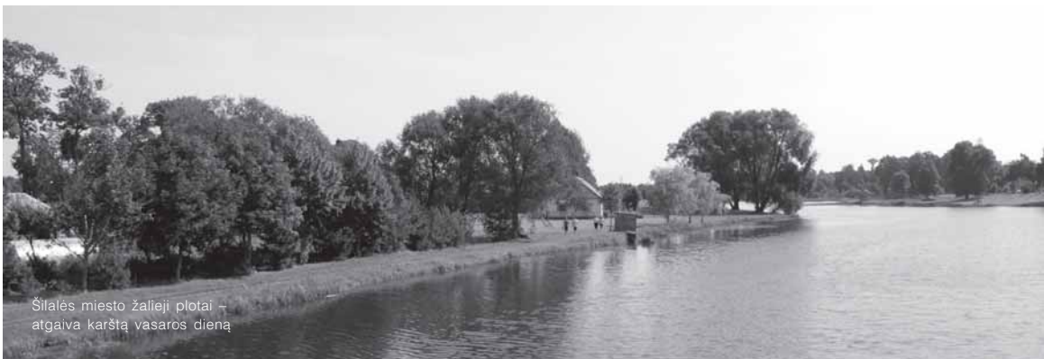
Šilalės miesto žalieji plotai – atgaiva karštą vasaros dieną