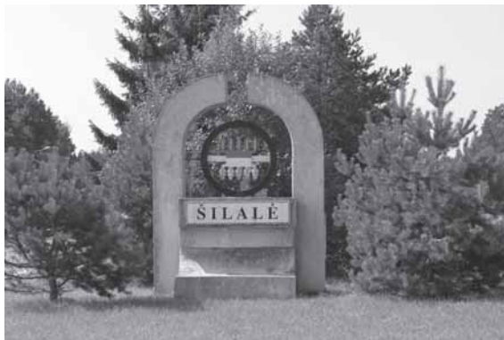
Šilalės miesto riboženkliis. Centre – miesto herbas