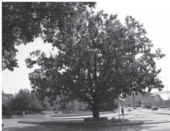
Lietuvos nepriklausomybės paskelbimo (1918 m. vasario 16-oji) dešimtmečiui skirtas ažuolas Šilalės miesto centre