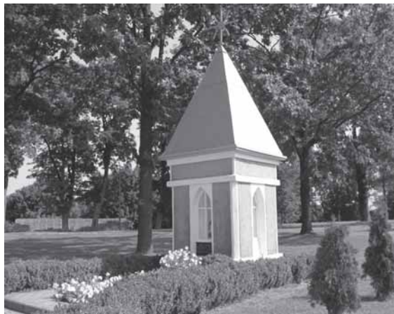
Koplytėlė Šilalės mieste, žyminti 1533 m. mieste pastatytos pirmosios katalikų bažnyčios vietą. Toje vietoje iš viso yra stovėjusios 3 medinės bažnyčios ir 1 mūrinė

1. Interneto svetainė „Šilalės rajono savivaldybė 0147 http://www.silale.lt/Silales-krastas/Apie-rajona (žr. 2010-07-03)