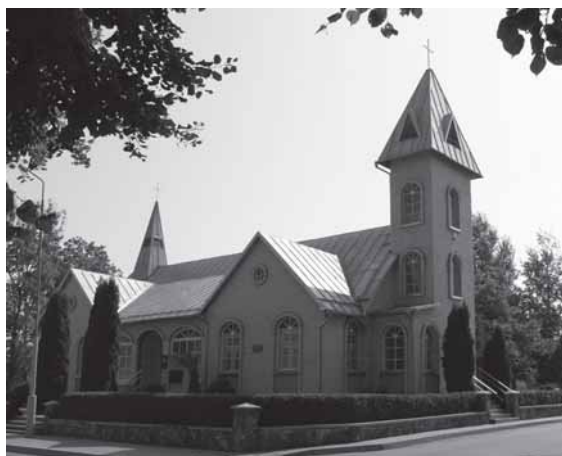
Šilalės liuteronų bažnyčia