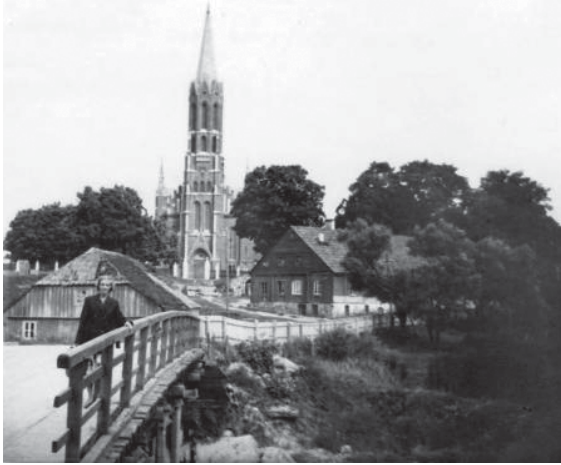
Viršuje – Šilalės šv. Pranciškaus Išpažinėjo baznyčia ir špitolė 1950 m.. Dešinėje – ta pati bažnyčia 2010 m. vasarą.