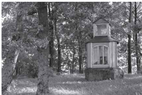
Koplytėlė prie kelio Upyna–Vytogala