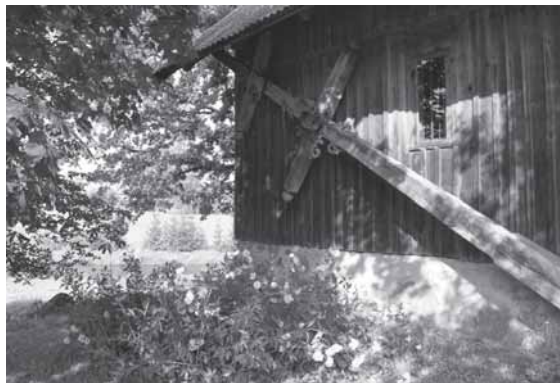
Kryžius Upynos liaudies amatų muziejaus ekspozicijoje