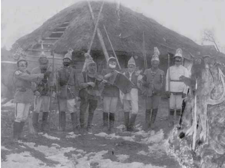
Upynos velykžydžiai-persirengėliai.