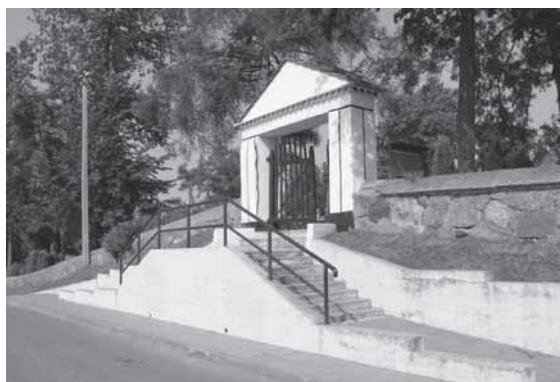
Iš kairės: Upynos Švč. Mergelės Marijos bažnyčios šventoriaus ir Upynos kapinių vartai