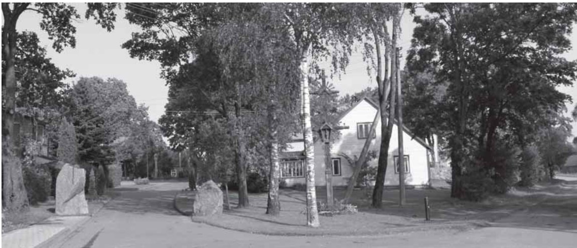
Uplynos miestelio centras. Gatvė, vedanti link bažnyčios ir muziejaus