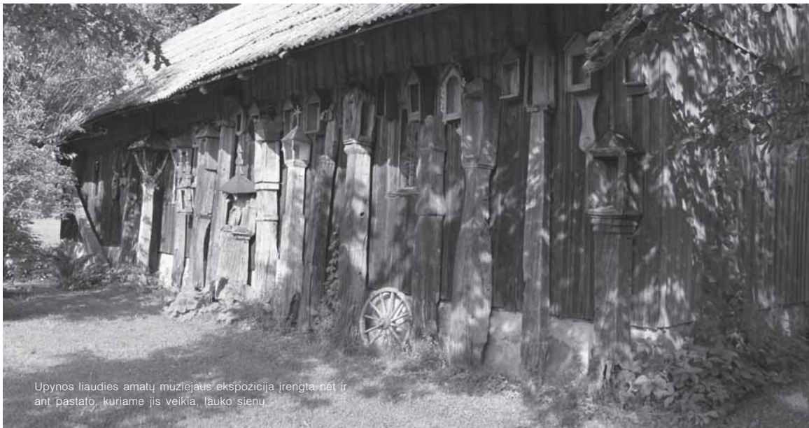
Upynos liaudies amatų muziejaus ekspozicija įrengta net ir ant pastato, kuriame jis veikia, lauko sieni.