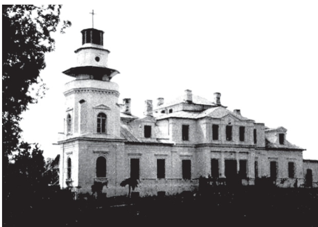
Pagrižuvė dvara rūmā tarpukarē Lietovuos metās, ka pastats priklausē vienuolems jezuitams

Pagrižuvīs onkstiau kuožnam atvīkosem ēr če gīvenontem širdi gluostē sava mēšrio anglēška stiliaus 35 ha dēdoma parko, katros bova suformouts 1840–1863 metās pagal tuo patēis arkitekta, katros pruojektava ēr rūmus – F. Rimgailas, pruojekta. Parks irēngts unt dvijū terasū: vēršotēnie – pri rūmu, ēr apatēnie – pri pat par dvara terētuorējē vingioujintē Blikēs opelioka. Parkē XX omžiaus pradiuo auga daug gieliū, dekuoratīviniū krūmu. Iš tuo išlēka mažā kas. Tēp ka tuo parka gruožību, ka dā ē neapsiautē vēsas upiu pakrontēs žaloma, nedēdlē bepamatīsi. Solaukiejē, sosēlējē retē augalā so savaimē augontēs medēs, krūmās ēr tik iš cēntrēnēs rūmu posēs esonti dēdliausē aikštē (parka parteris) mums ba žuo-