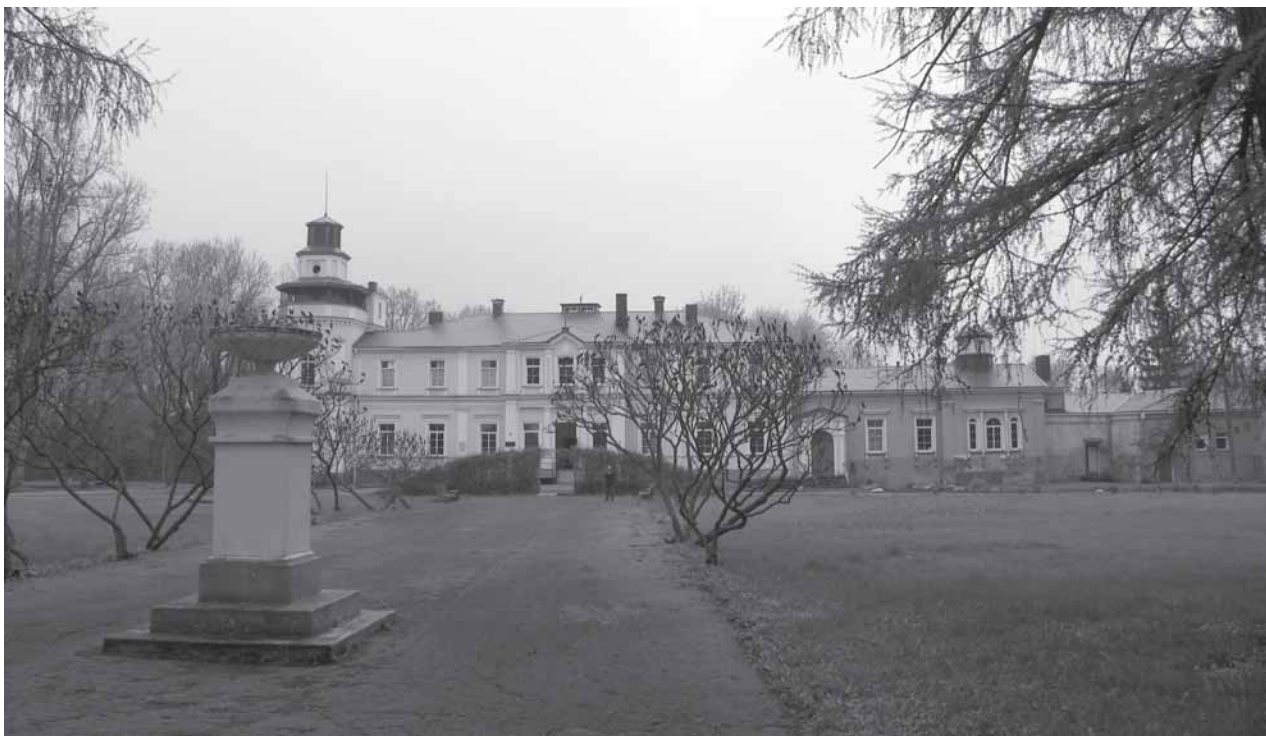
Pagrižuvē dvara suodība 2010 m. pavasari