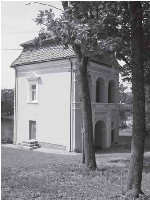
Kelmės dvaro vartai.