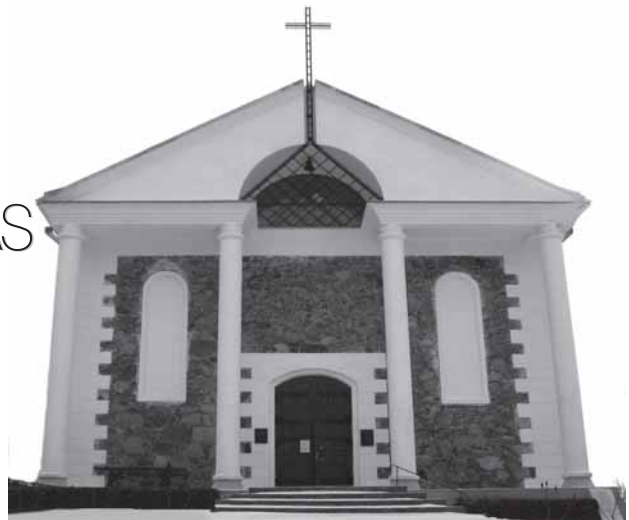
Kiaunorių bažnyčia (Kelmės r.).

Tai buvo architektas, „aistringai, beatodairiškai, scholastiškai mylėjęs architektūrą, patį kūrybos procesą.“ Gyvenime tai buvo „ryškus individualistas, kūrybinis lyderis ir idėjų generatorius. Sunikiai adaptuodavosi kolektyvinėje kūryboje, neretai ir dėl savo begalinio darbštumo. Visur, kur matydavo, jo nuomone, netobulus sprendimus, įkyriai „išdavo“ su savo pasiūlymais“. Taip Anapilin