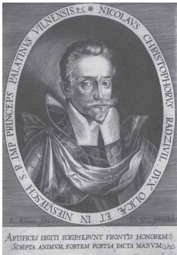
Iš kairės: L. Kiliano vario raižinys „Kražių pilies statytojo Mikalojaus Kristupo Radvilos portretas“. Iliustracija iš knygos „Senoji Lietuvos grafika“. Vilnius, 1995; M. K. Sarbievijaus poezijos rinktinės „Lemties žaidimai“ ( Ludi Fortunae Lyrica Selecta , 1632, graviūra sukurta pagal P. Rubenso piešinį). Iliustracija iš knygos Jurginis J., Lukšaitė I., Lietuvos kultūros istorijos bruožai , Vilnius, 1981, p.324