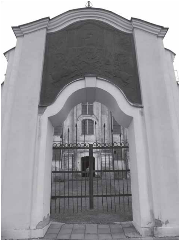
Kražių bažnyčios šventoriaus vartai. 2010 m.