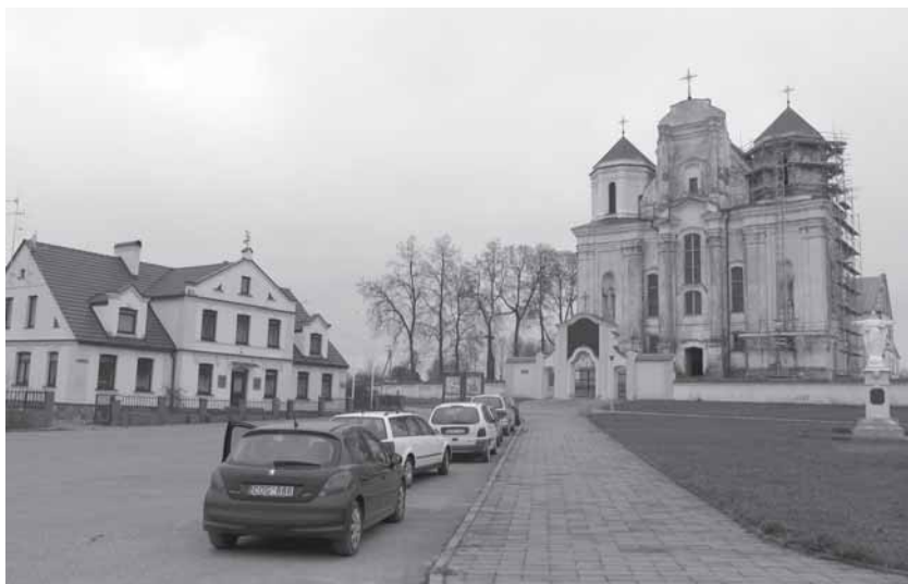
Kražė 2010 metu pavasari