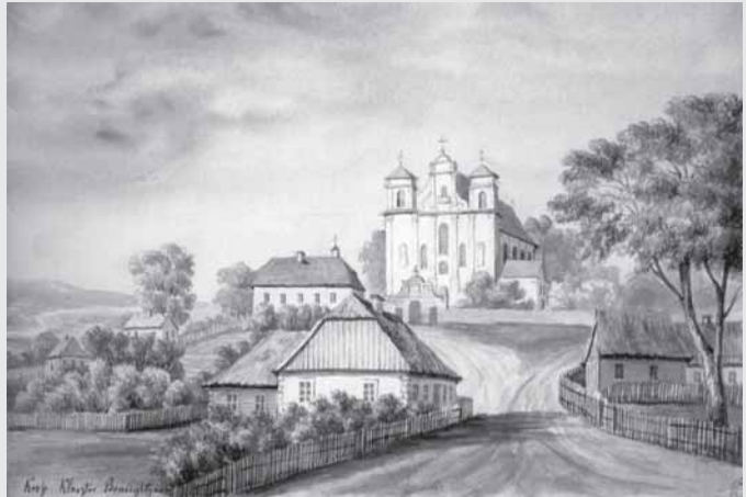
Napoleonas Orda. Kražiū benediktīniū bažnyčia. 1875 m. Pieštukas, spalvinimas, akvarelė, 19,6 x 29. Reprodukcija iš leidinio „Orda. Senosios Lietuvos architektūros peizažai“. Vilnius: Vilniaus dailės akademijos leidykla, 2006, p. 277