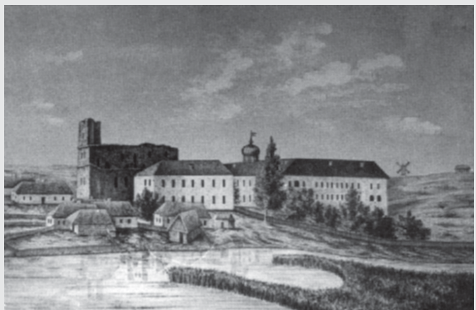
Buvusio Kražiū jėzuitū komplekso vaizdas nuo parapinės bažnyčios pusės. Menkarskio graviūra pagal 1840 m. V. Misevičiaus piešinį. Iliustracija iš A. Miškinio knygos „Lietuvos urbanistikos paveldas ir jo vertybės. III tomas. Vakarų Lietuvos miestai ir miesteliai. I knyga. Monografija“. Vilnius: „Savastis“, 2004, p. 247