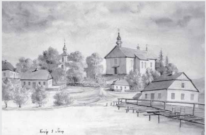
Napoleonas Orda. Kražiū parapinė bažnyčia. 1875 m. Pieštukas, spalvinimas, akvarelė, 19,6 x 28,5. Reprodukcija iš leidinio „Orda. Senosios Lietuvos architektūros peizažai“. Vilnius: Vilniaus dailės akademijos leidykla, 2006, p. 276