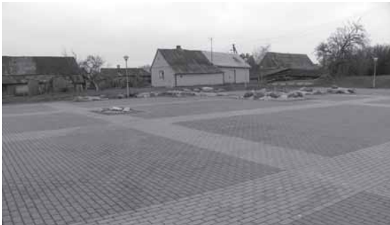
Restauroutas Kražiū kolegėjės bursas kėims, katramė grindėnie simbuolėškā akmėnū krūvuom ėr pažīmīetas kėtū senīau ėe stuoviejūsiu pastatū vėitas

Kražiūs nu 2007 m. rėngamė tradicėnės jau tapė Kražiū festivalė. Anū tėkslos – Lietovuos Dėdliuosės Konėgaikštītės (LDK) kultūrinīu tradicėju puoseliejėms ėr gaivėnėms, inpromacėjės aple anus sklaidā ėr vėsuomenės švėitėms. Par tus festivalius Kražiūs vīkst koncertā, spektaklė, atėdaruomas puofesionalīu dailinīku ėr tautuodailinīku kūrbas paruođas. Daug paruođū pastarāsės metās vīkst Kražiū M. K. Sarbievėjāus kultūras cėntrė.