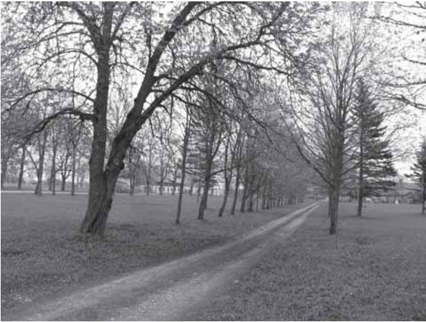
Iš kairies: Užventė dvara suodėbas parkas (taks link Užventė malūna); paminklos Lietuvos nepriklausomybės Akta signatarou Smilgevičė Juonou (skulptuorios Cikana Vids)