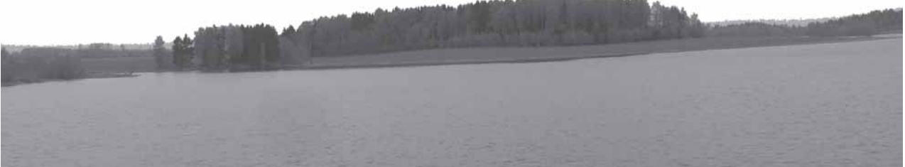
Vaiguvuos-Užventė apīlinkiu panuorama