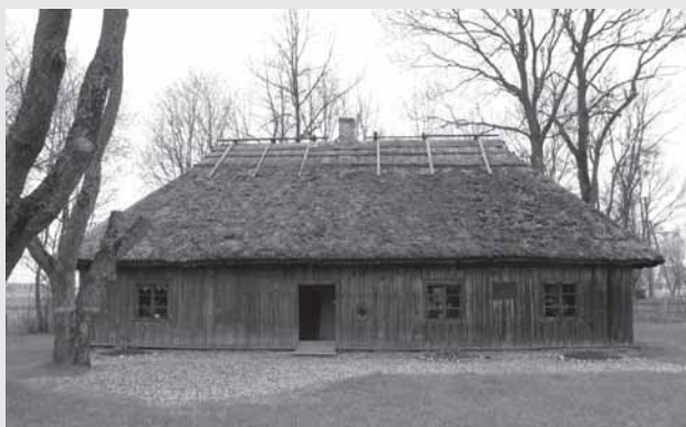
Višinskė Puovėla gimtasis noms, memuorialėnis muziejus