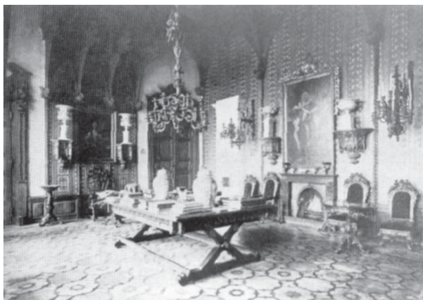
Beržėnų dvaro rūmų interjeras

Naująjį rūmų ansamblį savo akvarelės piešinyje yra įamžinęs Napoleonas Orda. Šis kūrinys priskiriamas tiems, kurie buvo sukurti N. Ordos 1875–1876 m. kelionės po Žemaitiją metu. Jis yra datuotas 1875 m. rugpjūčio 23 d. Šiame piešinyje užfiksuotas pirmasis Beržėnų dvaro rūmų variantas. Kai kurios jo detalės skiriasi nuo vaizdų, įamžintų vėlesnėje ikonografijoje. Skiriasi centrinė rytų fasado dalis, oranžerijos ir salono jungtis, kuri buvo