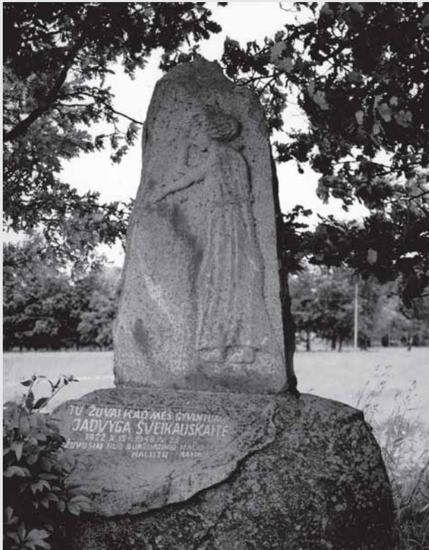
J. Liaudansko sukurtas paminklas Jadvygai Šveikauskaitei (stovi prie kelio Kelmė–Tytuvėnai). 1972 m. Granitas. Nuotrauka iš Alfredo Širmulio archyvo