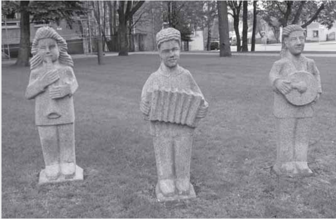
Juozo Liaudansko skulptūros „Muzikantai“ Kelmės miesto skvere.