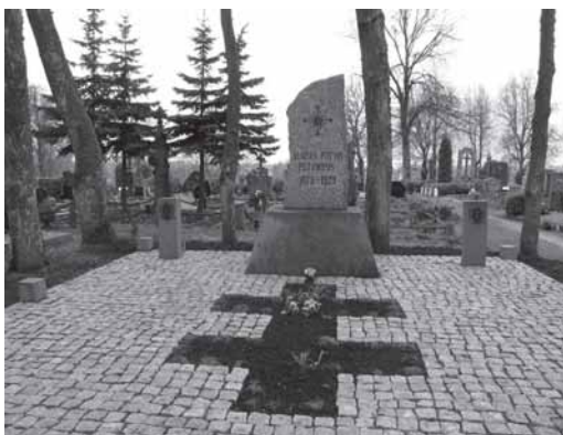
Šaliū sājungas ikūriējē, vēsuomenēs veikijē Putvinskē-Pūtvē Vlada kaps Kelmēs kapēnīs