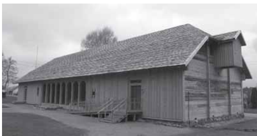
Restaurouts seniausis Lietovuo žēnuoms svērnš stuov bovosē Kelmēs dvara suodības terētuorējuo, anamē jau veik Kelmēs krašta muziejaus etnuograpēnē ekspuzicējē