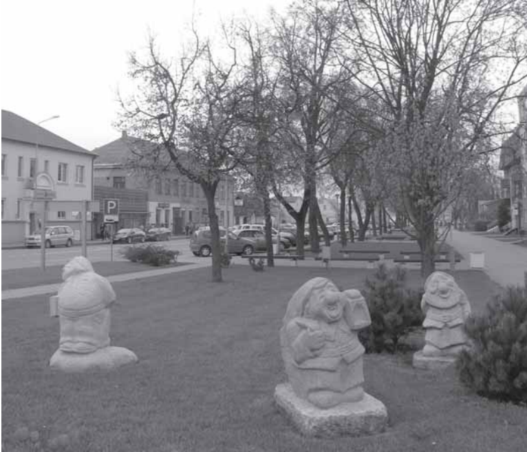
„Nikštokā“ Kelmės miesta skverė. Skulptuorios Bandza Valds