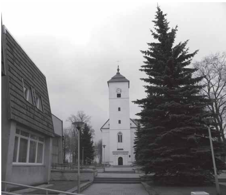
Priekie – Kelmēs evangelēku liuteronu bažņičē