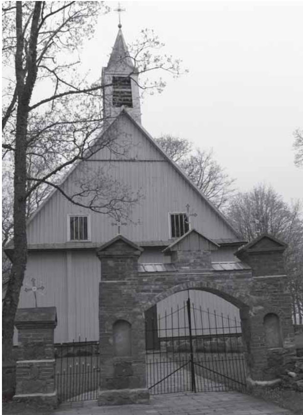
Mairuonių Švč. Mergelės Marijos bažnyčia