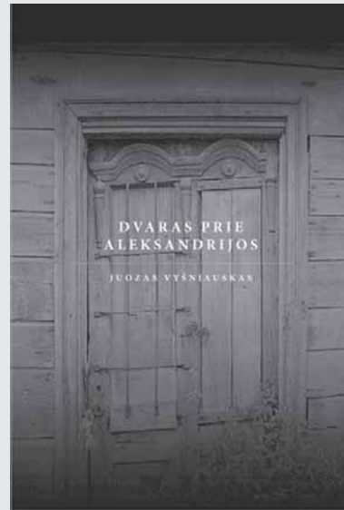
Knygos „Dvaras prie Aleksandrijos“ viršelis