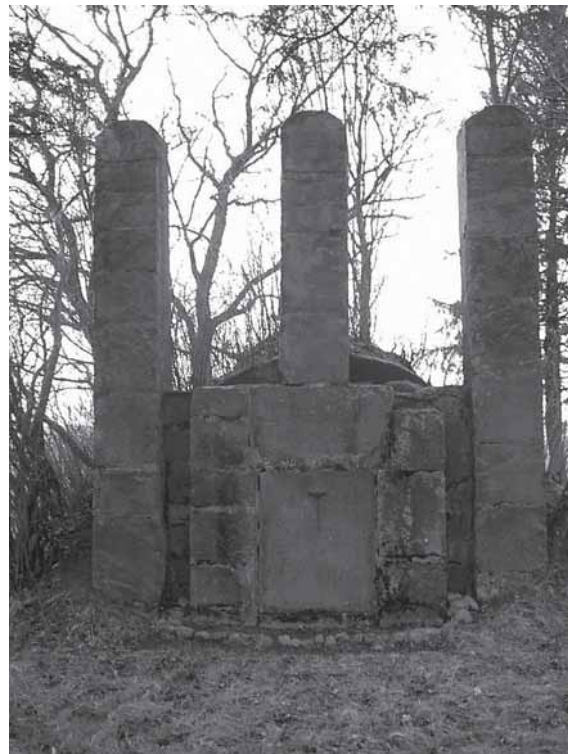
Daktaro Boleslovo Kauno-Kaunackio kapas-rūsvis su Gedimino stulpais Bugenių kaime

minti dar dėl vieno dalyko: kad jį pramokytų lotynų kalbos, tėvai į namus buvo parsivežę truikiniškį Tadeušą Knipavičių.