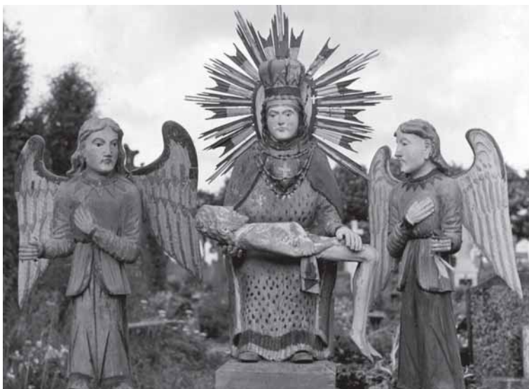
Ēš kairies: „Marijē Skausminguoji”. Šaukliū kaims. Portēgrapouta 1962 m.; skulptūrēnē grupē „Pieta”. Īlakiū kapēnēs. Portēgrapouta 1972 m.

mantizma nerasi. Veizi i tas skulptūras ēr atruoda, ka priš tavi stuov tuos žmounēs, ēšvargintē sunkiū darbū, žemēšku nelaimiu, skausma.