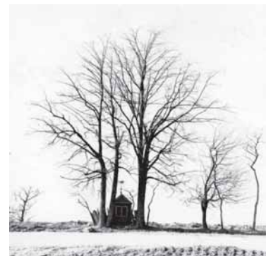
Vēršou – Vindeikiu kaima kopitlētē; Kairie – kryžios Nuotienu kaima suodībuo. Portērapouta 1962 m.

Vēina ēš žimiasiu liaudēs skulptūras tīrenietuouju Mikienātē Akvilē ir pažimiejosi, kad žemaitēškas liaudēs skulptūras ēš kētū regējuonu panašiu darbū ēšsēskēr sava tēkruovēškomo. Čē – nikuokē lirizma, ruo-