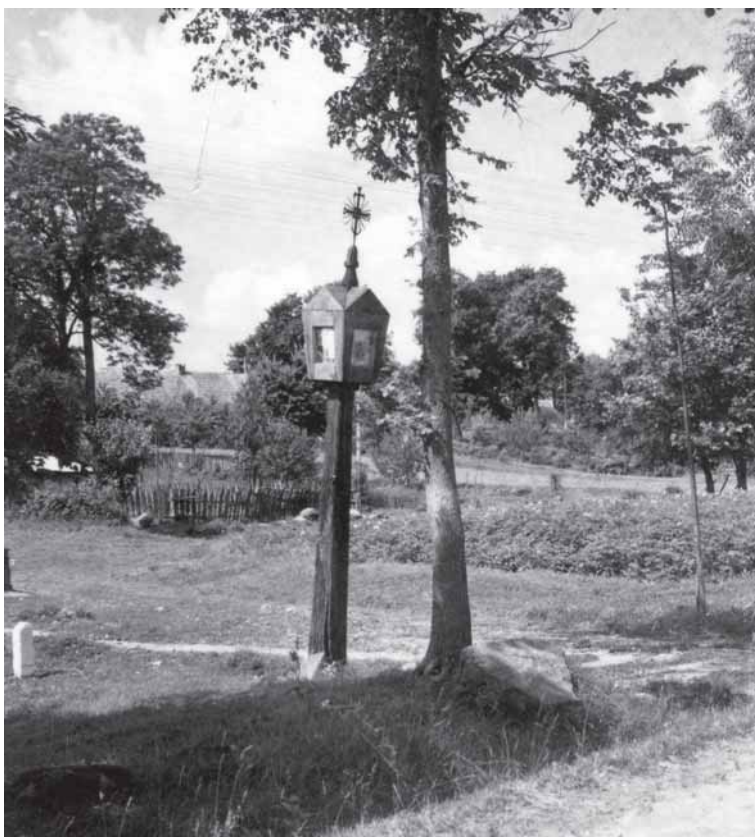
Šaukliū kaima kuoplītstolpis. Portēgrapouta 1962 m.