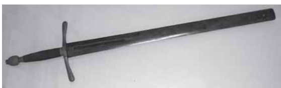
Dievo malonėje žengiame visi amžinybėn, kai aš kalaviją AVF THV. Todėl tyras aš nuo nuodėmės prieš amžiną gyvenimą (užrašas vokiečių kalba) Skuodo budelio kalavijo (1525 m.) kopija, saugoma Skuodo muziejuje.

padariau savo amžiuje: pamūrijau bažnyčią ir perleidau vyskupo aplankymą. Dabar galiu drąsiai pasakyti, kad bet kuris klebonas yra dauggalis, nes, teturėdamas kišenėje 18 rublių, pradėjau fabriką ir pabaigiau.“ 12