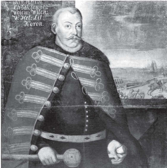
Jonas Karolis Chodkiewicz (1560–1621). Paveikslas saugomas Kretingos Viešpaties Apreiškimo Švč. Mergelei Marijai bažnyčioje.