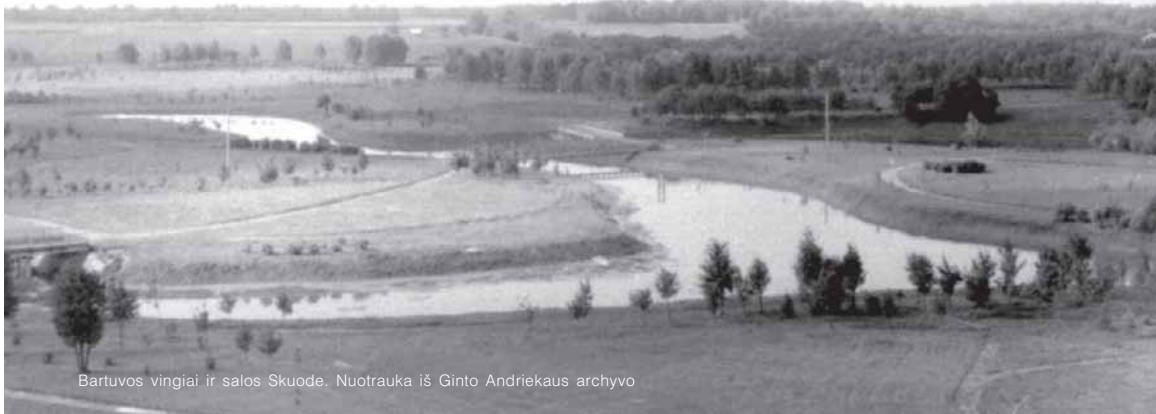
Bartuvos vingiai ir salos Skuode.