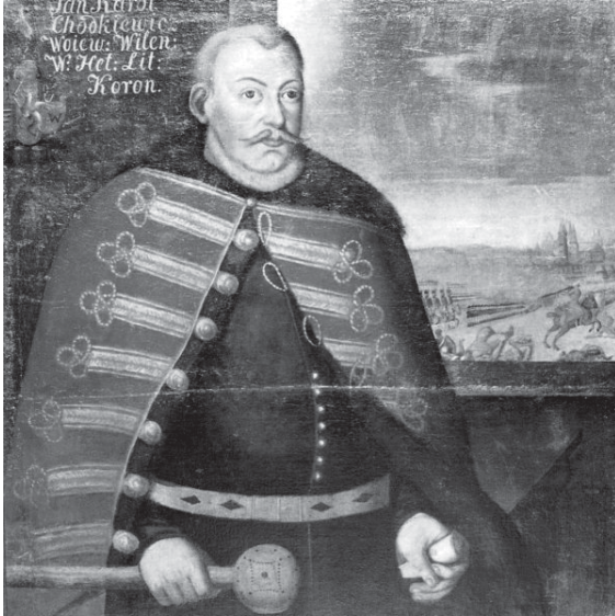
Jonas Karolis Chodkevičius (1560–1621). Paveikslas saugomas Kretingos Viešpaties Apreiškimo Švč. Mergelei Marijai bažnyčioje.