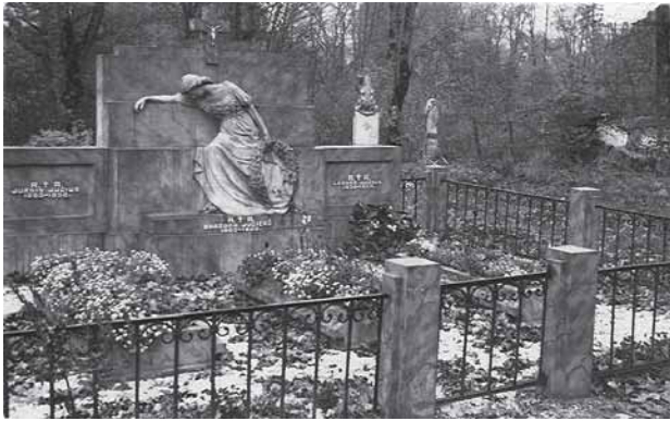
Jucių šeimos antkapinis paminklas „Liūdintis angelas“ seniau. Pastatytas 1952 m. Autorius – Adomas Jakševičius