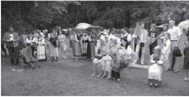
Vėršou – lītos Lietovuos dainū švėntės neaplėnkė, bet uns ni šuokieju, ni dainininku, ni žiūruovu dėdlė neėšgousdəna. Dešėnie – Gedimina kalns Vilniou 2009 m., Lietovuos dainū švėntės dėinuoms

muoksleivių dainų dėina „Skombou vaikīstės suodnā“. Nu 18 valonduos Šv. Juonū bažničiuo bova sosėrinkė kankliu mozėkas gerbiejė – vīka koncerts „Skombiekėt, kanklės“.