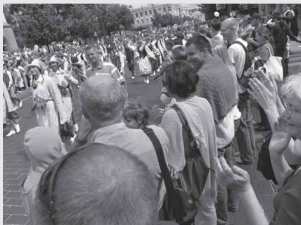
Lietovuos dainū štvēntēs dalīviu eisēna Gedimīna pruospekto (Vilnīs, 2009 m. lēipas 6 d.)