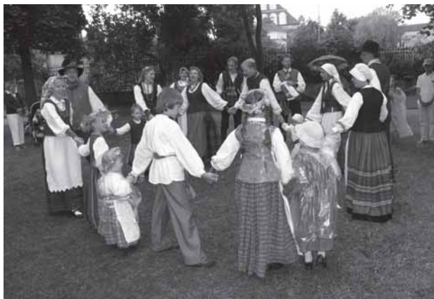
Žemaitė 2009 m. Lietovuos dainū šventie ne tik šuoka, dainiava, grajėjė, bet rada pruoguos i veselė sosėrinkosėms vilnėškėms primintė ēr aple gėlė šaknis i mūsa gīvenėma ileidosės tradicėjės ēr papruotius

„Amžiu amžiai – tai amžinybė, begalinis laikas iš praeities į ateitį, iš amžių glūdumos į amžių šviesą, iš neįžvelgiamos gelmės į neįžiurimą aukštį, iš giliausios šaknies į skaisčiausią žiedą, spindintį viltyse tarsi pati saulė. Taip auga amžinasis ažuolas, mūsų pasaulio medis, ant kurio viršūnės štai vėl nutūpė iš dangaus skardžiabalsis mūsų dainų paukštis ir pragydo praamžių gaidų naujomis dermėmis, mūsų prieštaringos Dalios sutartinėmis, kuriomis visų mūsų skirtingus balsus į vieną audinį be paliovos audoja bendra mūsų Laima. Nes sutarti – tai ne būti visiems vieno veido, ne dainuoti vienu balsu, bet, dainuojant savo nepakartojamą širdies dainą, gir-