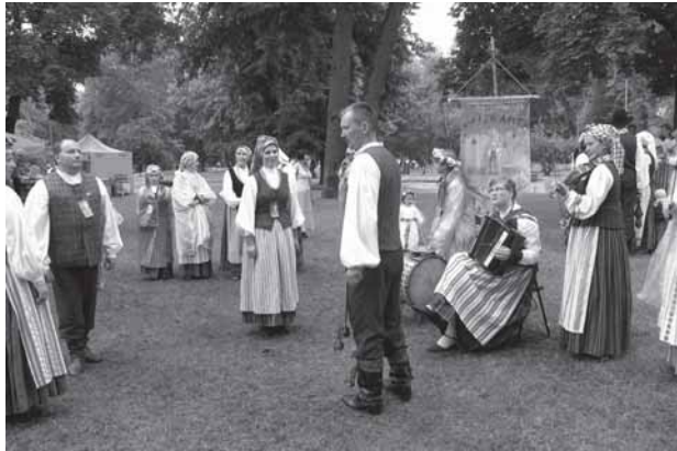
Sereikėškiu parkė vikosiuo Folkluora dėiniu koncertoun ansamblis „Vaizgamta“. 2009 m. lėipas 4 d.