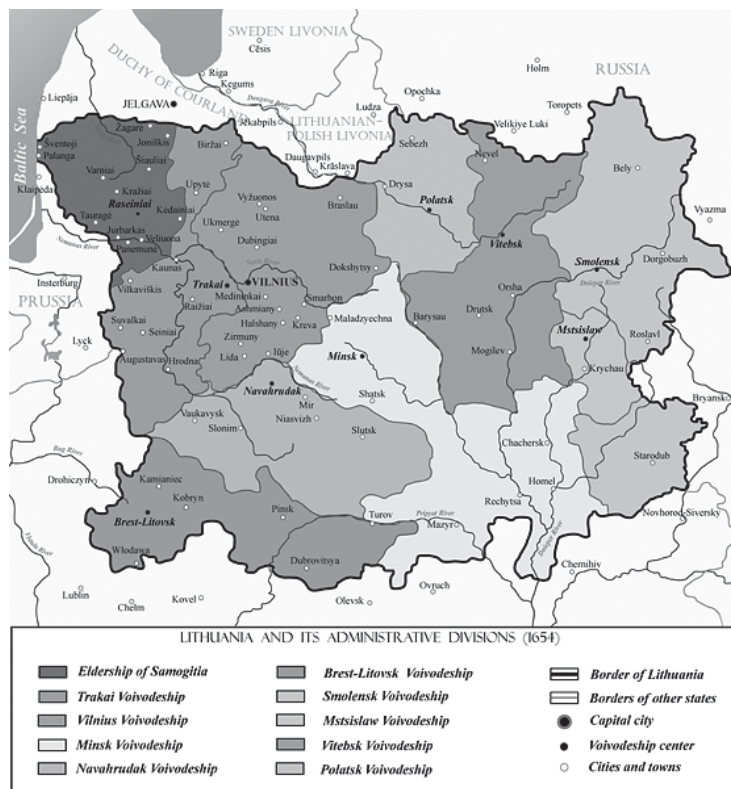
Žemaitija (viršuje, kairėje) Lietuvos Didžiosios Kunigaikštystės žemėlapyje. 1654 m.