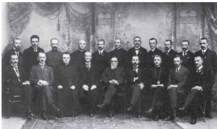
Lietuvos tarybos nariai, Lietuvos nepriklausomybės Akto signatarai (sėdi iš kairės): Jonas Vileišis, Jurgis Šaulys, Justinas Staugaitis, Stanislovas Narutavičius, Jonas Basanavičius, Antanas Smetona, Kazimieras Šaulys, Steponas Kairys, Jonas Smilgevičius. Stovi (iš kairės): Kazimieras Bizauskas, Jonas Vailokaitis, Donatas Malinauskas, Vladas Mironas, Mykolas Biržiška, Alfonsas Petruelis, Saliamonas Banaitis, Petras Klimas, Aleksandras Stulginskis, Jokūbas Šernas, Pranas Dovydaitis. Vilnius, 1918 m. vasario mėnuo.

Nuotraukos saugomos Lietuvos nacionaliniame muziejuje