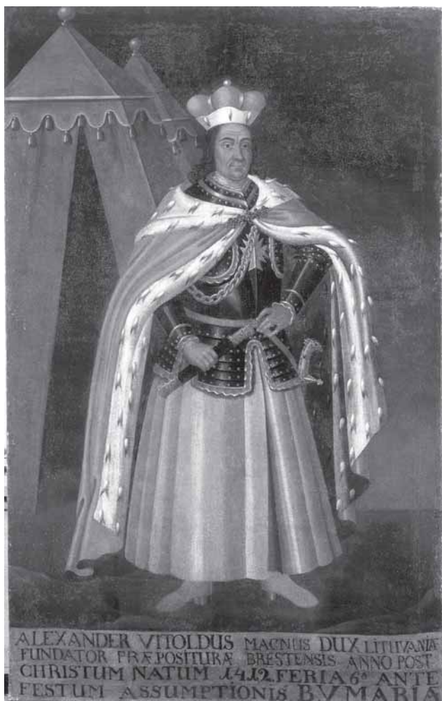
Vytauto Didžiojo portretas. Nežinomas XVII a. Lietuvos dailininkas. Kūriny s augomas Lietuvos dailės muziejuje.