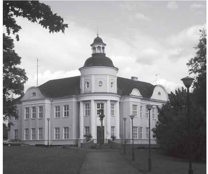
Iš kairės: Žemaičių ir Telšių vyskupijų vyskupų sąrašai Telšių katedros sienos įmontuotose memorialinėse lentose, Telšių vyskupijos kurija.