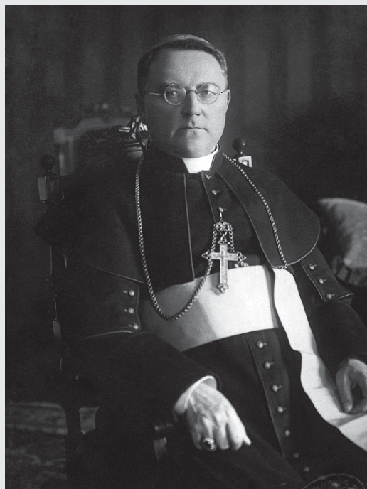
Telšių vyskupas, Lietuvos Nepriklausomybės Akto signataras Justinas Staugaitis.

Telšių vyskupas Justinas Staugaitis daugeliui Lietuvos žmonių žinomas ne tik kaip Lietuvos Nepriklausomybės Akto (1918 m. vasario 16 d.) signataras, bet ir kaip žurnalistas, visuomenės veikėjas. Gimė jis 1866 m. lapkričio 19 d. Tupikų kaime (Naumiesčio vlsč., Šakių r.). Jo tėvai buvo valstiečiai. Kelią į mokslą Justinas pradėjo 1877 m. Iš pradžių lankė Naumiesčio (dab. Kudirkos Naumiestis) pradžios mokyklą, vėliau – Marijampolės gimnaziją, o 1885–1890 m. studijavo Seinų kunigų seminarijoje, baigęs ją, buvo išventintas į kunigus. Jau seminarijos metais išryškėjo pagrindinės J. Staugaičio interesų sritys – Bažnyčios vieta tautos ir valstybės gyvenime bei katalikiški idealai ir jų puoselėjimas, sklaida.